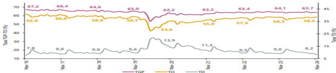
Gráfico 2. Tasa global de participación (TGP), Tasa de ocupación (TO) y Tasa de desocupación (TD) Total nacional Noviembre (2016 - 2024)

Para el mes de noviembre de 2024, la tasa de desocupación del total nacional fue 8,2%, lo que representó una disminución de 0,8 puntos porcentuales respecto al mismo mes de 2023 (9,0%). La tasa global de participación se ubicó en 63,7%, mientras que en noviembre de 2023 fue 64,1%. Finalmente, la tasa de ocupación fue 58,5%.