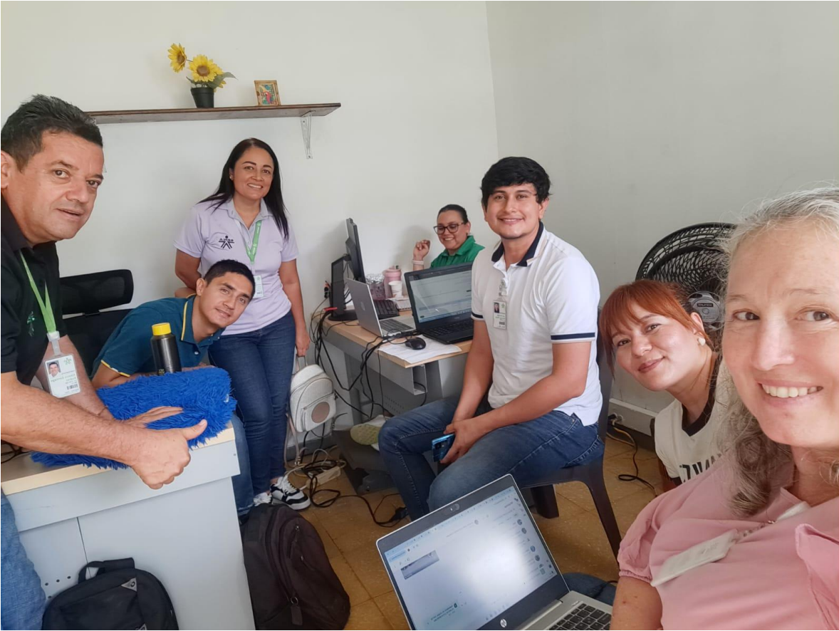
Reunión de orientaciones para archivo.