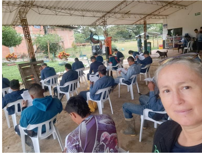
Prueba de conocimiento normas corte y recolección de racimos en la empresa Palmeras la Paz