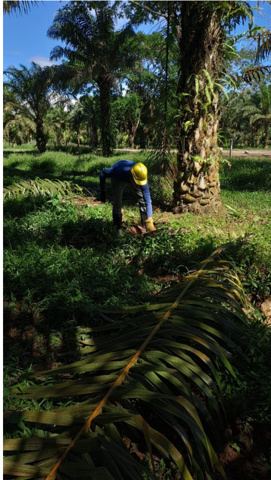
Toma de desempeño y producto de la norma corte y recolección de racimos en la empresa Palmeras la Paz