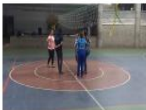
Desplazamientos adelante y atrás