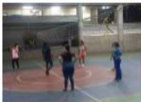
Porte para hacer cruzados con parejo