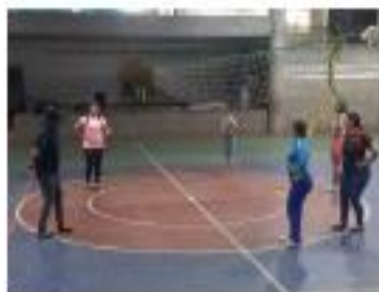
Paso básico con lateralidades