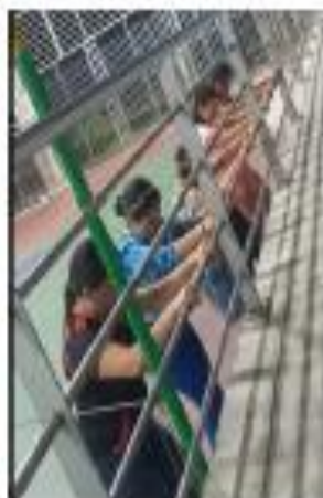
Primer día de escobillados