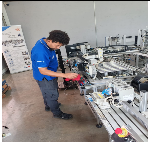
Técnico en integración de operaciones logísticas, Guachené. Ficha No. 3141767, Lunes de 07:00 a 13:00 horas.