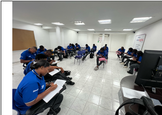
Técnico en integración de operaciones Logísticas, ficha No. 3176005, Puerto Tejada, Lunes y Martes de 13:00 a 19:00 horas.