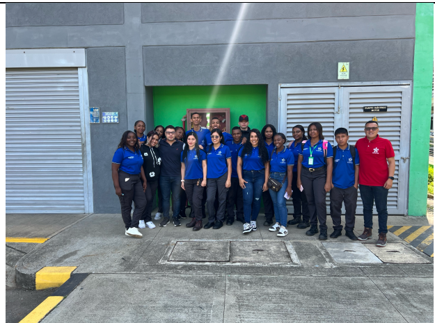
Técnico en integración de operaciones logísticas, Sede la samaria Santander de Q. Ficha No. 3141818, Martes de 07:00 a 13:00 horas.