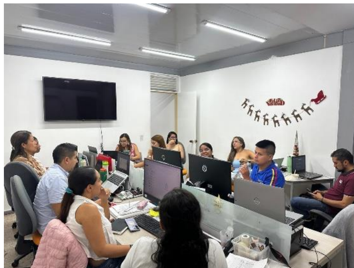
4-12-2025 Reunión de equipo psicosocial – Realización de proyectos