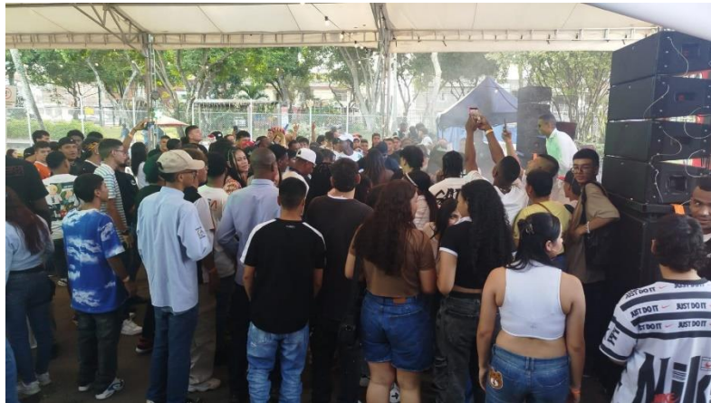
2 -02-2025 Integración fin de año Jornada nocturna