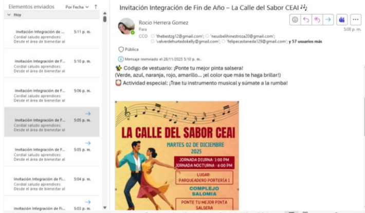
2 -02-2025 Integración fin de año diurna