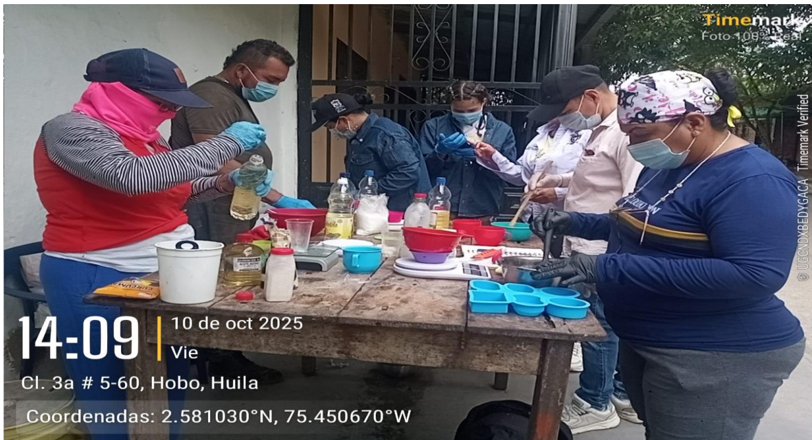
Comunidad de familias en el municipio de Hobo con la ficha 3235113 con la formación DESARROLLO DE ACCIONES DE PROMOCION AMBIENTAL COMUNITARIO.

14:09 | 10 de oct 2025 Vie Cl. 3a # 5-60, Hobo, Huila Coordenadas: 2.581030°N, 75.450670°W