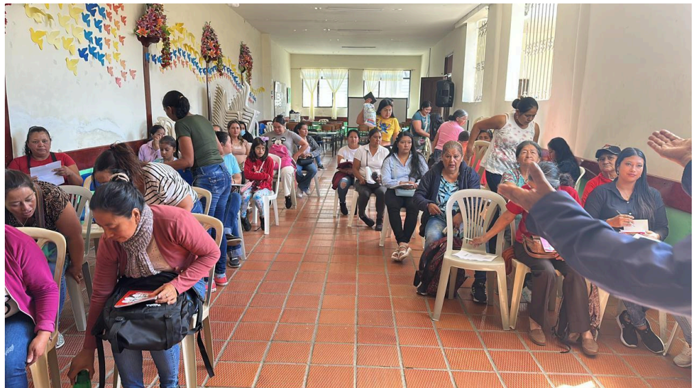
Fotografía de la formación