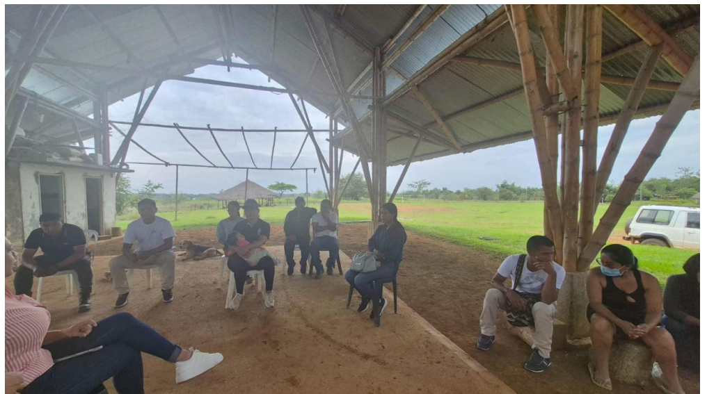
Fotografía de la formación

Documento de reporte de Gestión de tiempos de Sofia Plus