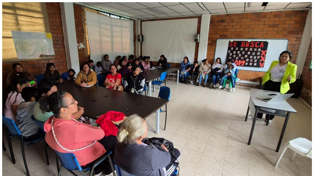
Fotografía de la formación