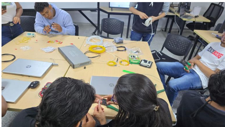
Formación a grupo GRD 40