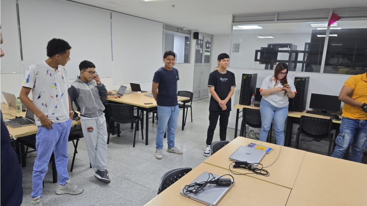
Formación a grupo GRD 40