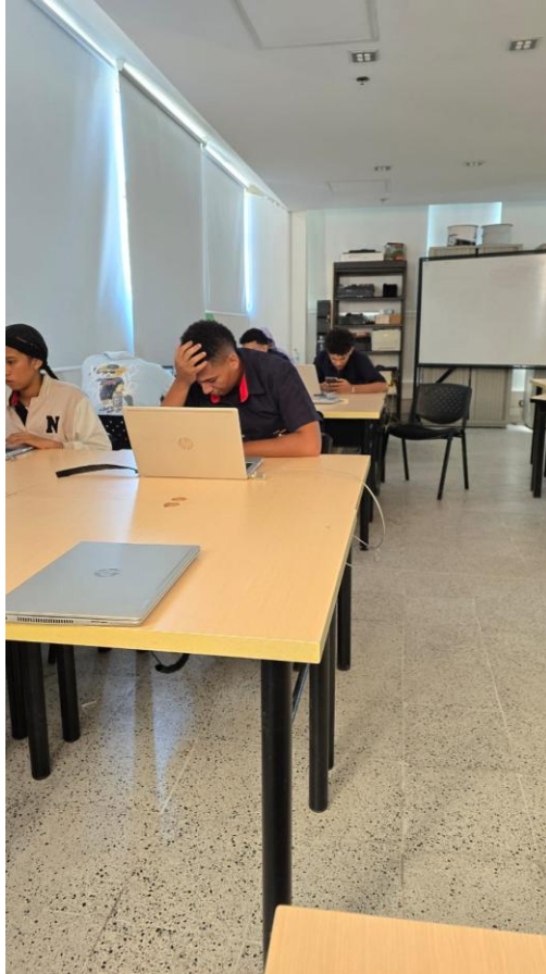
Formación a grupo GRD 35