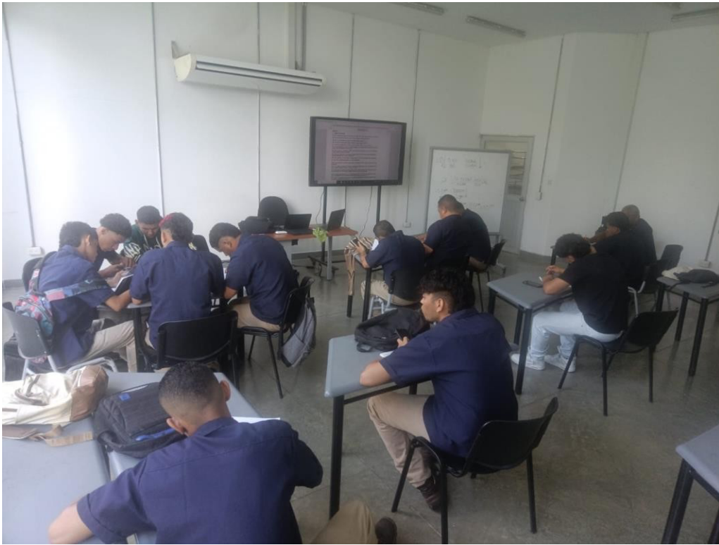
MAAER – 36 01-12-2025