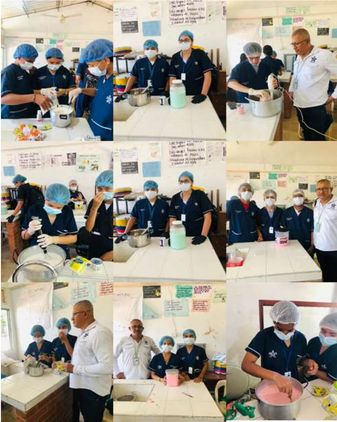
Evidencia 5- Valor agregado al proceso de ordeño