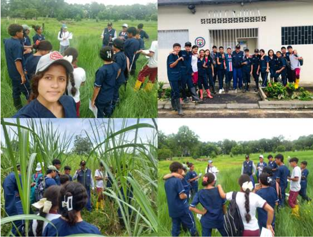
Evidencia 2- Revisión de actividad de campo COLEGIO JUAN PABLO II – grado decimo