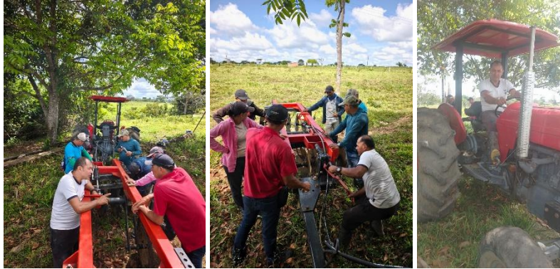
Formación Calamar. Ficha 3393933