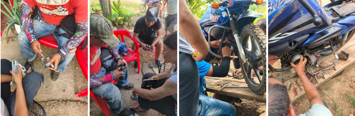
Registro fotografico ficha 3403236