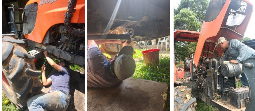
Formación en Caño Blanco II. Ficha 3390288