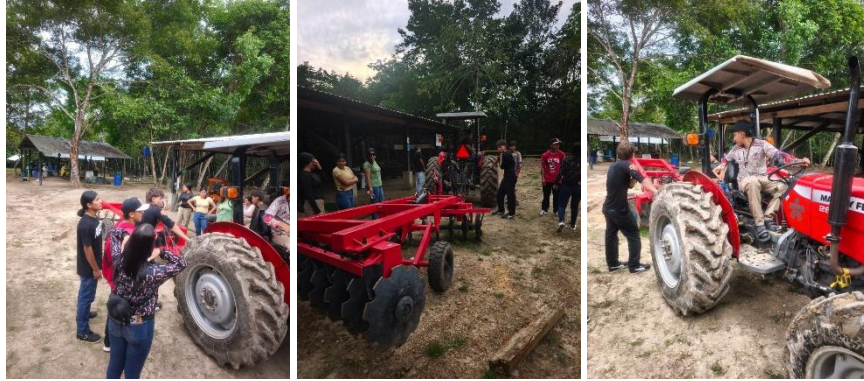
Formación en San José del Guaviare. Ficha 3372421

Básico en mantenimiento y operación del tractor. Ficha 3372421