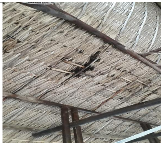
Se observó deterioro en la cubierta de palma amarga del kiosco en varias partes