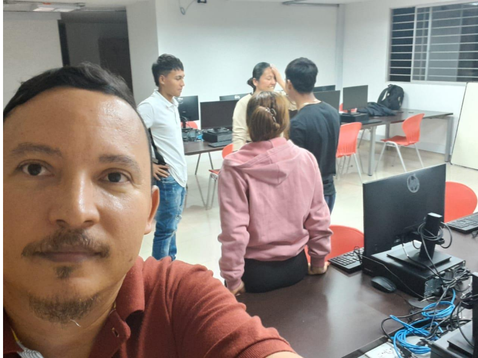
Ficha; 3316745 Sesion virtual. Ejecución de programas deportivos, Yacopi.