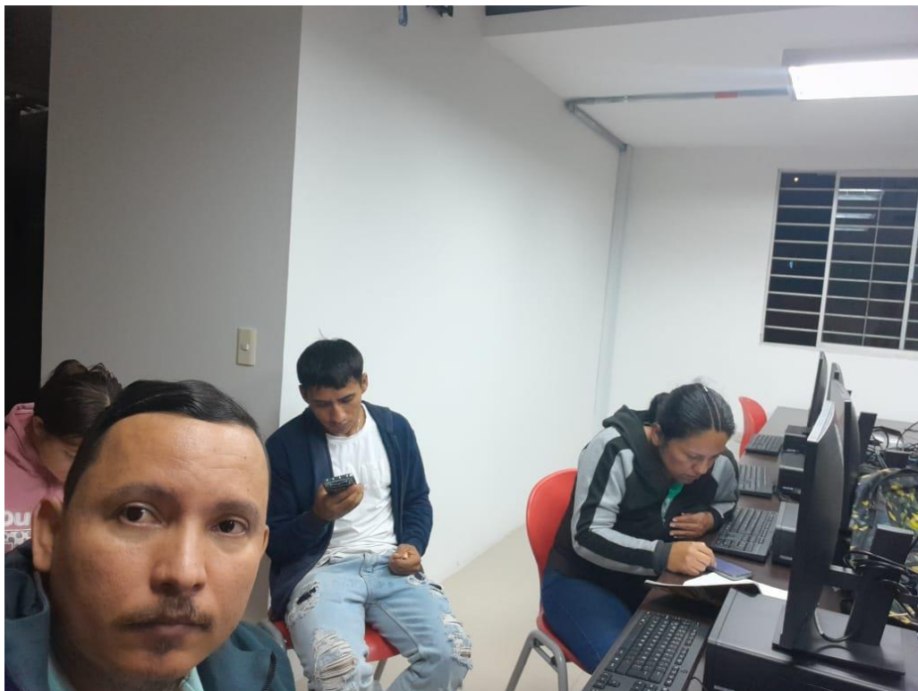
Sesión del viernes 5 de diciembre, Yacopi. Ficha 3316745, Ejecución de programas deportivos.