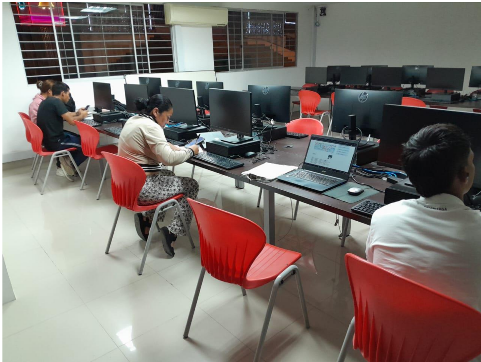
Sesión del miércoles 10 de diciembre, Yacopi. Ficha 3316745, Ejecución de programas deportivos.