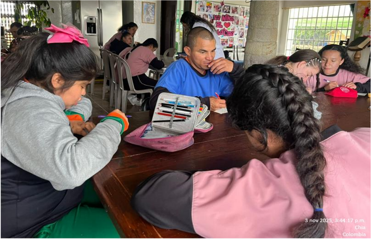
3 nov 2025, 3:44:17 p.m. Chia Colombia