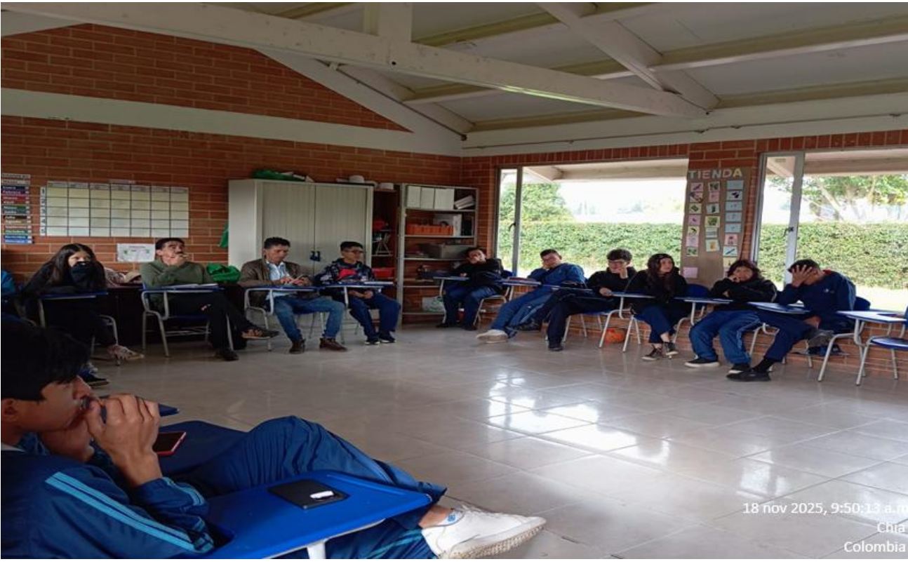
18 nov 2025, 9:50:13 a.m. Chia Colombia