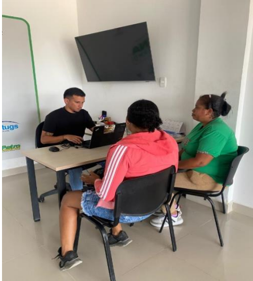
Día 1: Atención a Población Víctima