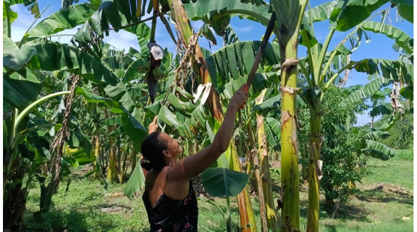
Imagen 3. Valoraciones de Producto en la norma 270401112 sembrar cultivo de acuerdo con especificaciones técnicas y buenas prácticas agrícolas, a los candidatos del municipio de Fonseca.