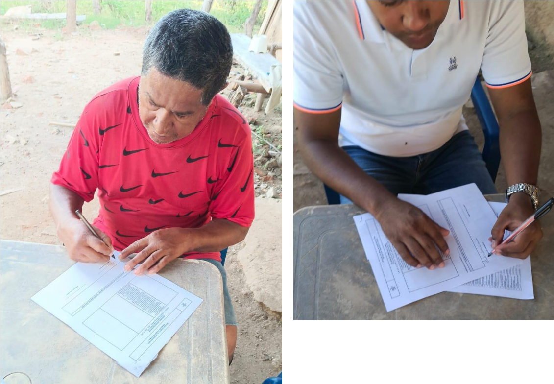
Imagen 1. Valoraciones de prueba de conocimiento en la norma 270401112 sembrar cultivo de acuerdo con especificaciones técnicas y buenas prácticas agrícolas, a los candidatos del municipio de Fonseca.