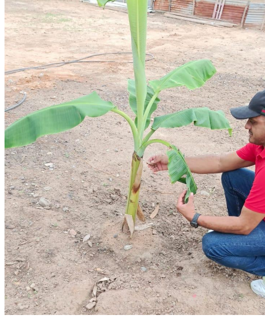
Imagen 2. Valoraciones de prueba de desempeño en la norma 270401112 sembrar cultivo de acuerdo con especificaciones técnicas y buenas prácticas agrícolas, a los candidatos del municipio de Fonseca