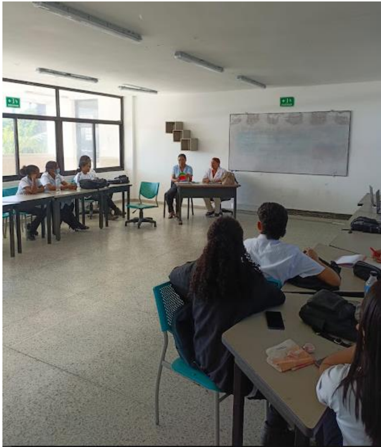
Ilustración 6: consejería grupal - proyección 26 semáforo diagnóstico/04/1272025/ficha sgst7 ambiente gestión