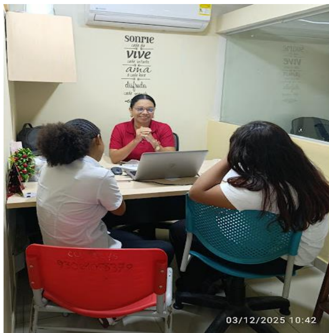
Ilustración 3: consejería individual- riesgo deserción/03-12-2025-aprendiz sgst- ambiente bienestar