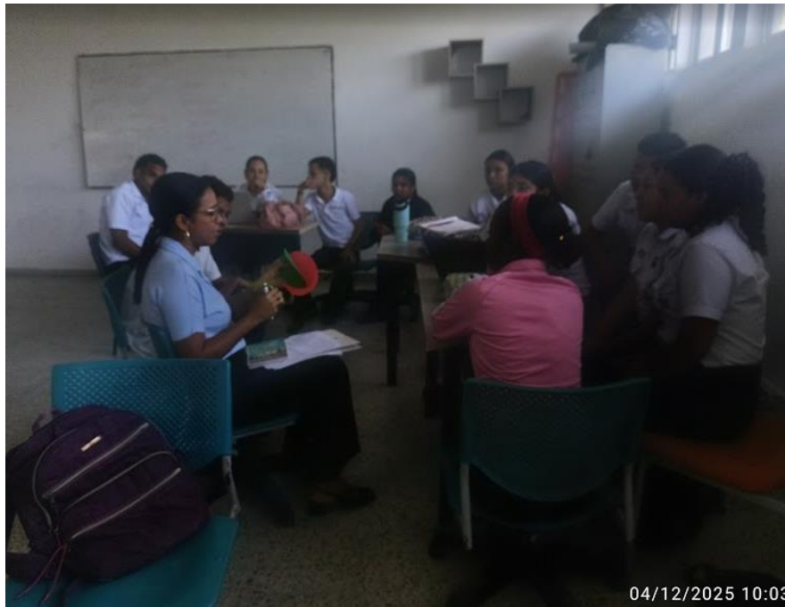
Ilustración 5: consejería grupal - proyección 26 semáforo diagnostico/04/12/2025/ficha 3175065 sgst7 ambiente gestión

https://drive.google.com/drive/folders/1pSXRNKAHxOjinG0SSErIYY1I-xjTRa?usp=drive_link