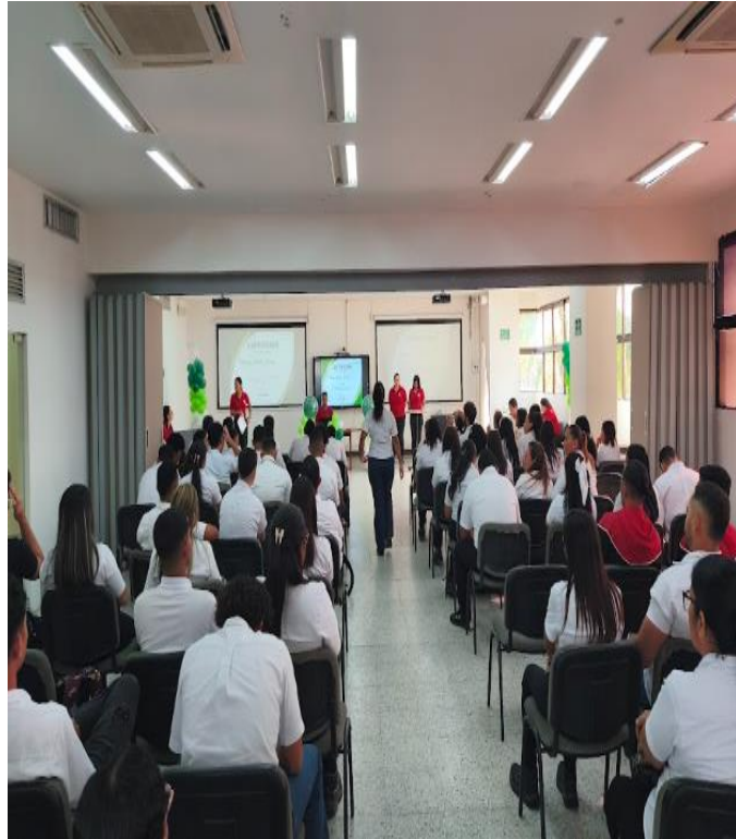
Ilustración 4: Acompañamiento aprendices excelencia que culminan etapa lectiva/03 diciembre/ salón empresarial

https://drive.google.com/drive/folders/1pSXRNKAHxOjinG0SSErIYY1I-xjTRa?usp=drive_link