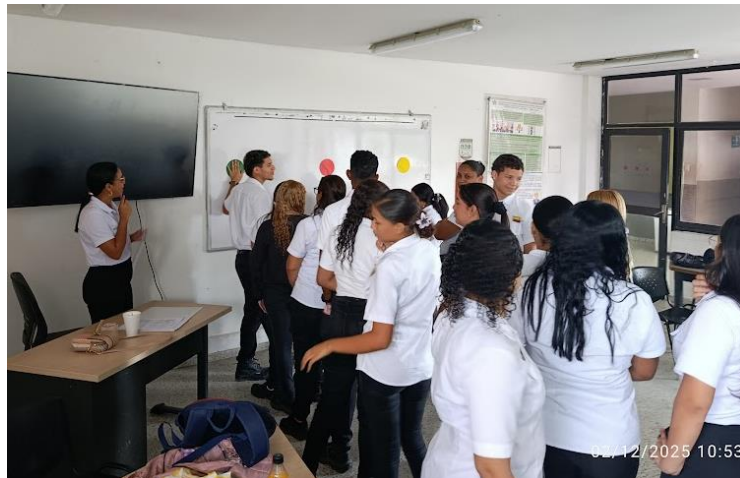
Ilustración 1: consejería grupal - proyección 26/0271272025/ficha 3231747 sgst7 ambiente gestión