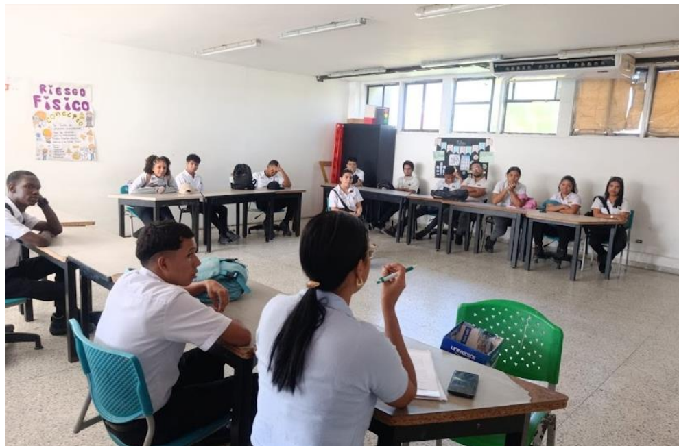
Ilustración 7: consejería grupal - proyección 26 semáforo diagnóstico/ficha sgst7 ambiente gestión 2998883-04-12-2025