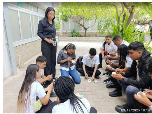
Ilustración 8: Reunion e voeros- Clausura- 09 de diciembre / nodo de construcción https://drive.google.com/drive/folders/1UQ6SFv9rueVktmmMrTdtFyevitgNIRDG?usp=sharing