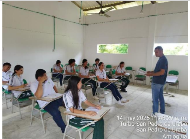
14 may 2025 11:48:29 a. m. Turbo-San Pedro de Urabá San Pedro de Urabá Antioquia