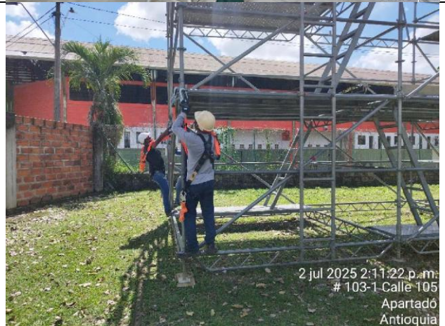
2 jul 2025 2:11:22 p. m. # 103-1 Calle 105 Apartadó Antioquia