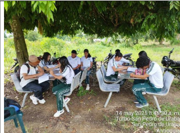
14 may 2025 8:46:30 a. m. Turbo-San Pedro de Urabá San Pedro de Urabá Antioquia