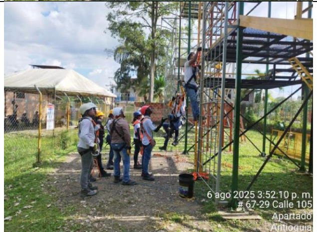
6 ago 2025 3:52:10 p. m. # 67-29 Calle 105 Apartadó Antioquia