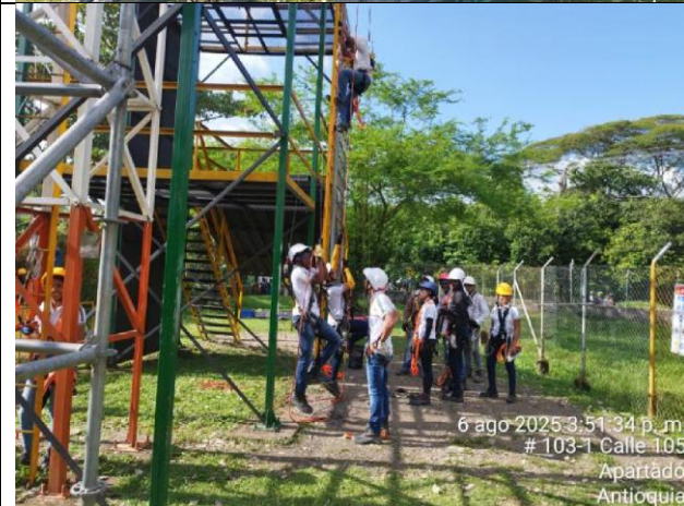
6 ago 2025 3:51:34 p. m. # 103-1 Calle 105 Apartadó Antioquia