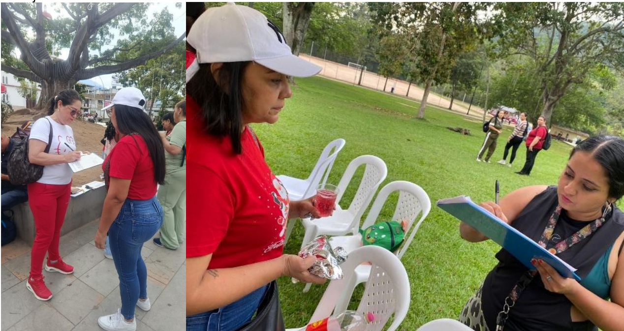
1. Evidencia Fotográfica

Realice apoyo en la conmemoración del día de la madre comunitaria realizado el día 27 de noviembre del 2025, en cajasan recrear.