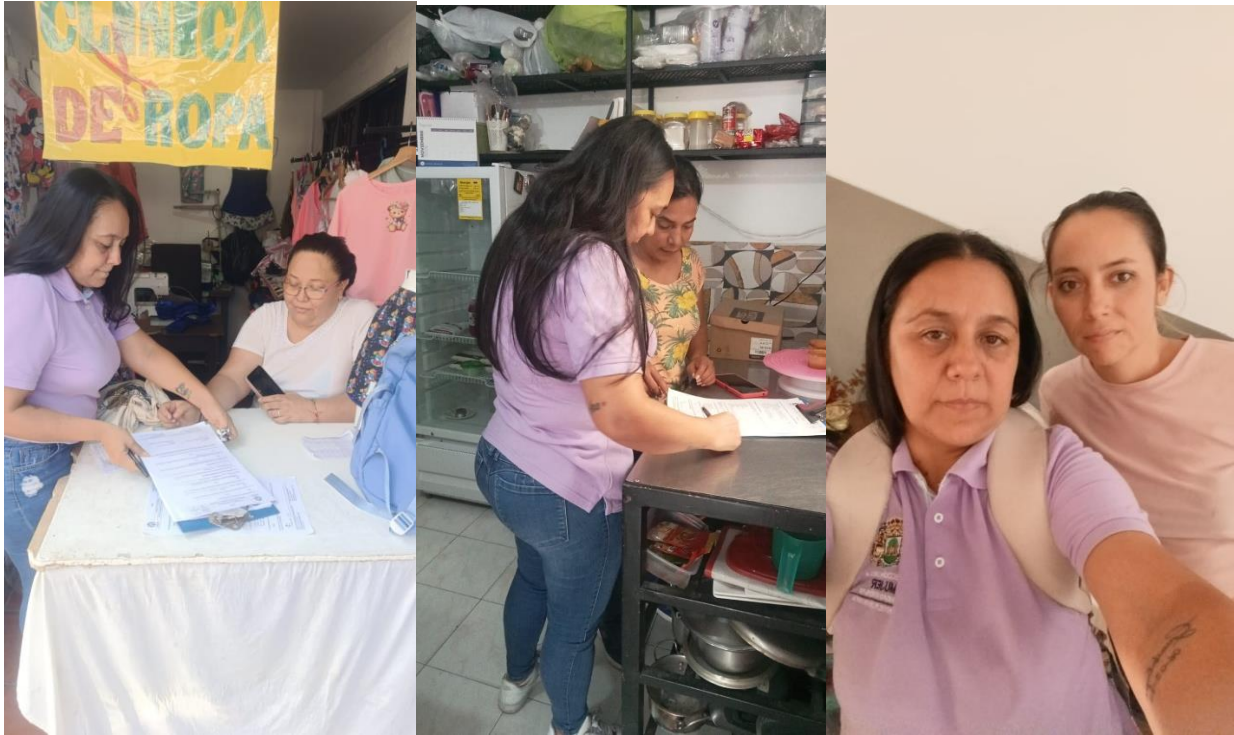
4. evidencia fotográfica

Realice las visitas a las mujeres seleccionadas para la entrega de las unidades productivas, realizadas el día 21 y 26 de noviembre del 2025.