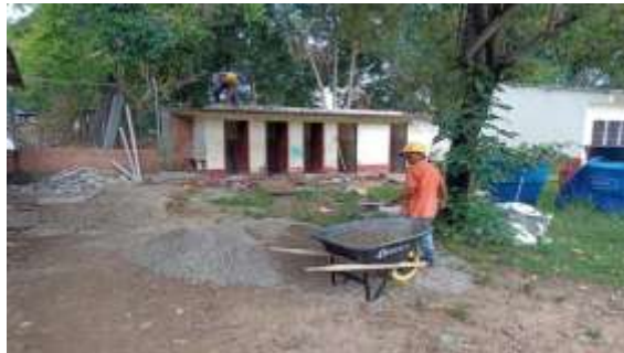
INSTALACION SANITARIA, PUNTOS HIDRAULICOS