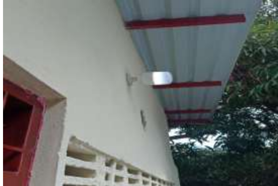
Adecuación unidades sanitarias primaria sede Guayaquil