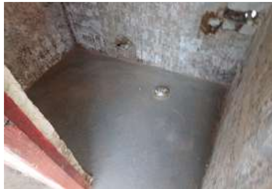
ANDEN Y PISOS EN CONCRETO DE 3000 PSI