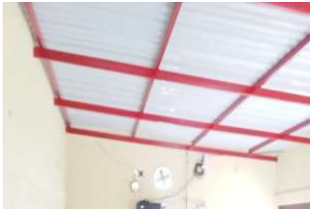
RESANE DE MUROS, INSTALACION PINTURA MUROS Y ESTRUCTURA METALICA