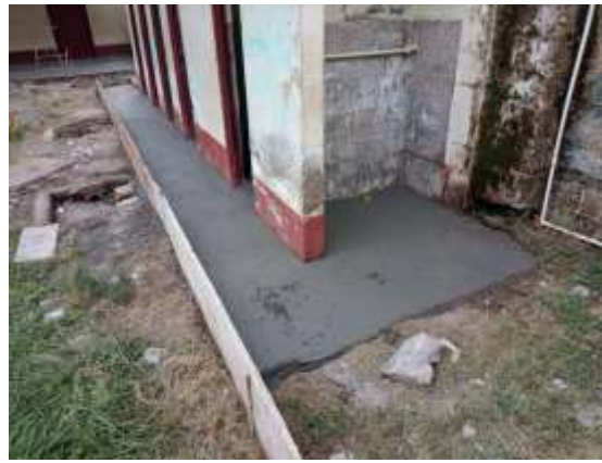
PICADA DE CERAMICA, CERAMICA NUEVA, MUROS Y PISOS