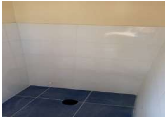
RESANE, PINTURA MUROS Y PUERTAS