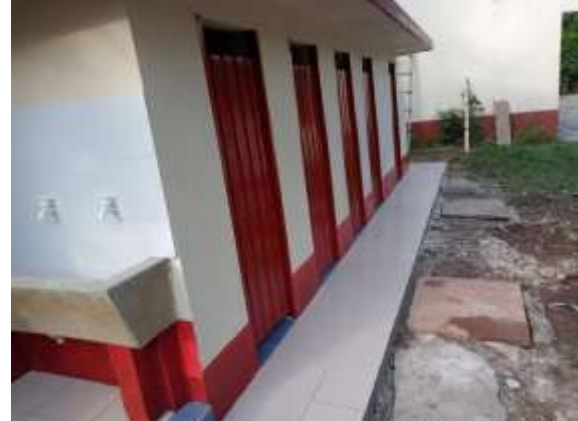
ARREGLO PUERTAS Y LAVAMANOS