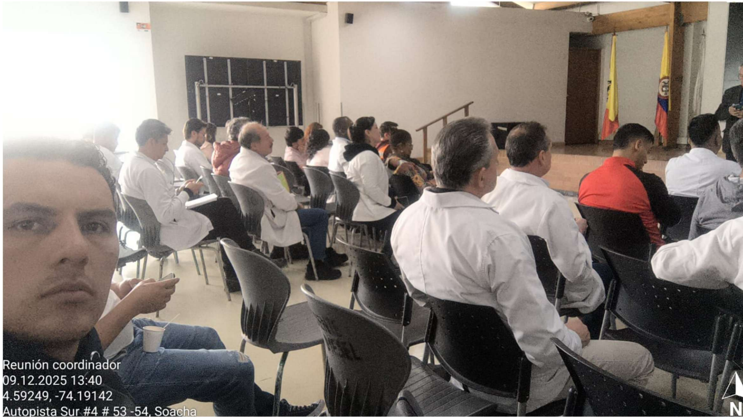
Reunión coordinador 09.12.2025 13:40 4.59249, -74.19142 Autopista Sur #4 # 53 -54, Soacha