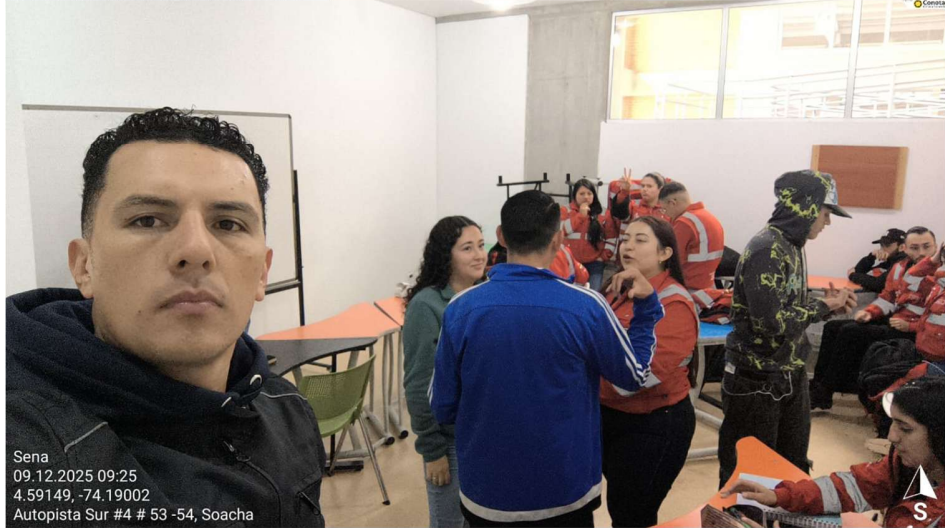
Sena 09.12.2025 09:25 4.59149, -74.19002 Autopista Sur #4 # 53 -54, Soacha