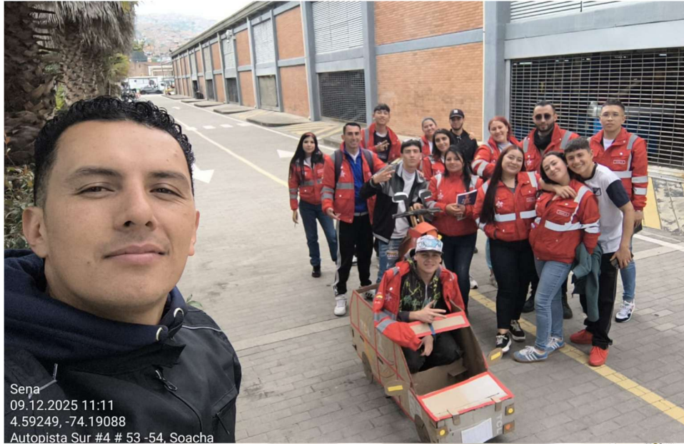
Sena 09.12.2025 11:11 4.59249, -74.19088 Autopista Sur #4 # 53 -54, Soacha