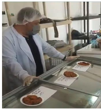
Fotos 11 y 12. Test sensorial, estandarización de productos COMERCIALCOOP