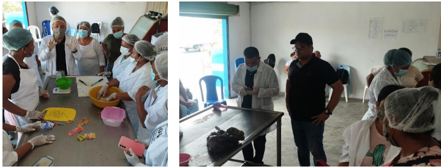
Fotos 3 y 4. Actividad apoyo con TECNOPARQUES - COMERCIALCOOP