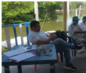
Fotos 13 y 14. Fortalecimiento actividad productiva CRIA PEZ