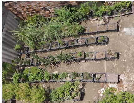
Fotos 17 y 18. Fortalecimiento deshidratación de frutas y especies medicinales ACUIAGRO