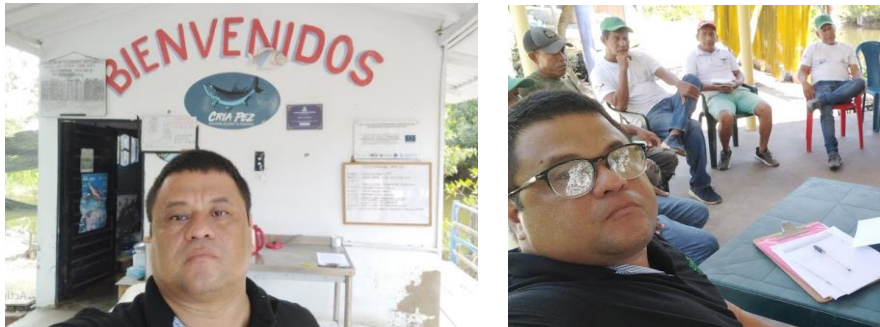
Fotos 5 y 6. Fortalecimiento actividad productiva CRIA PEZ