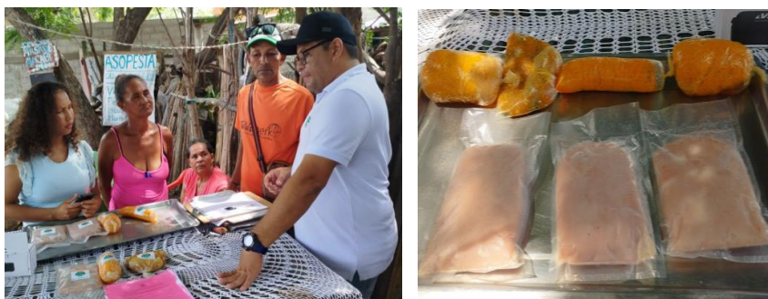
Fotos 7 y 8. Fortalecimiento ASOPESTA