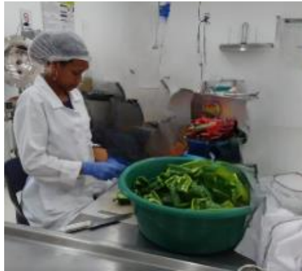
Fotos 9 y 10. Elaboración de productos pesqueros ACUIAGRO