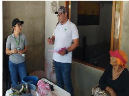
Fotos 15 y 16. Acompañamiento capacitación manipulación de alimentos ASOPESTA