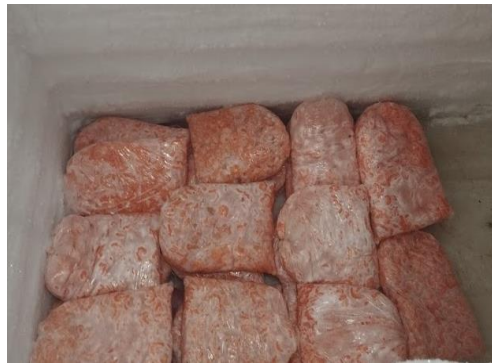
Fotos 19 y 20 Fortalecimiento unidad productiva congelación camarón COMERCIALCOOP