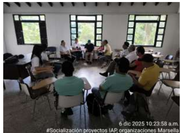
6 dic 2025 10:23:58 a.m. #Socialización proyectos IAP organizaciones Marsella