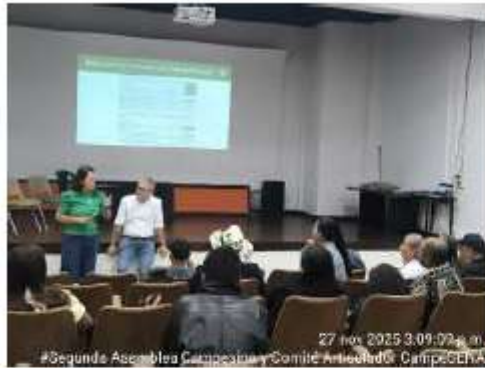
27 Nov 2025 3:09:09 p.m. #Segunda Asamblea Campesina Comité Ampelad@ Campesina