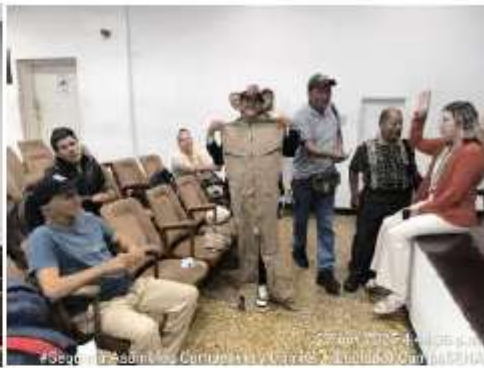
27 Nov 2025 4:05:55 p.m. #Segunda Asamblea Campesina Comité Ampelad@ Campesina