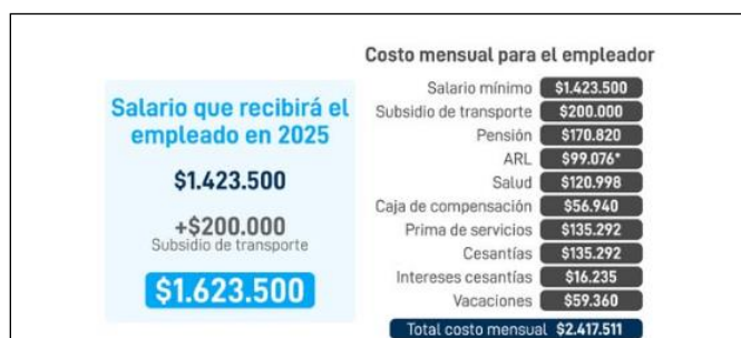
Tabla: Cuadro de costos de personal

-Variación salario mínimo legal vigente: El salario mínimo para 2025 aumentó un 9,54%, situándose en $1.423.500, y el auxilio de transporte se incrementó un 15%, alcanzando los $200.000. Este aumento salarial podría generar un efecto inflacionario, ya que las empresas podrían trasladar el incremento de costos laborales a los precios de bienes y servicios, lo que afectaría el poder adquisitivo de otros segmentos de la población. Tras el ajuste, el costo total para los empleadores incluyendo lo cargas prestaciones corresponderá a una suma mensual de $ 2.417.511.