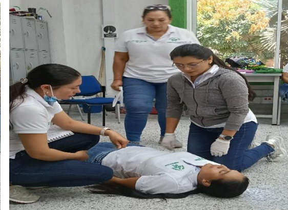
Soporte evidencia fotográfica actividad N 1 Y 6.