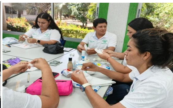
Soporte actividad N 17, Procesos de Comunicación asertiva.

Manejar herramientas informáticas asociadas al área objeto de la formación.