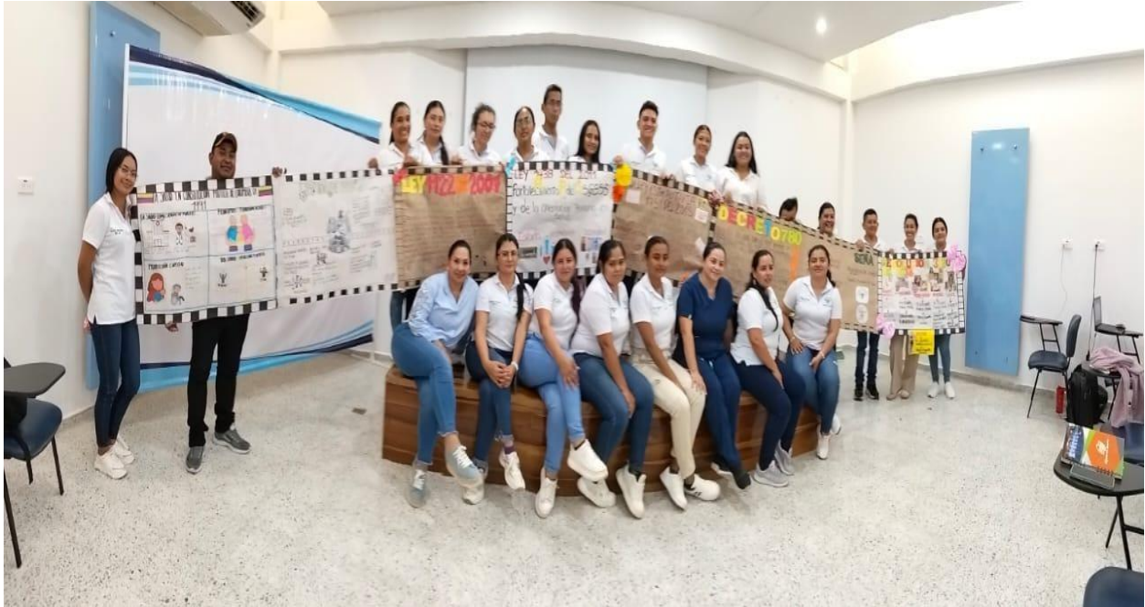
Soporte evidencia fotográfica actividad N° 8 y 9 proceso de inducción. actualización de la ejecución de la formación.