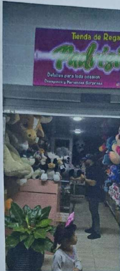
Fecha: 20 de Diciembre de 2025 Lugar: Tienda de Regalos Padrisimo – sector calle 21 Evento: Trasnochon Compro en mi Tierra