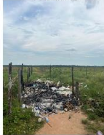
Elaboración de zona de residuos plásticos