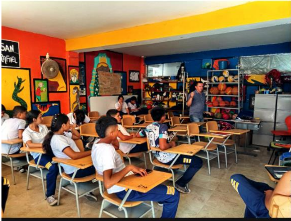
REUNION GENERAL CDAE VILLET A