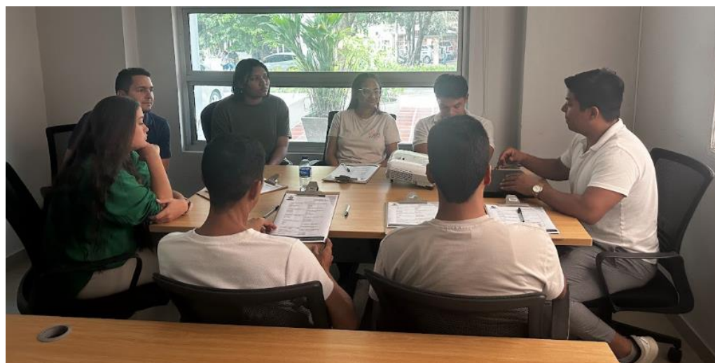
Reunión con equipo de trabajo actividades iniciales