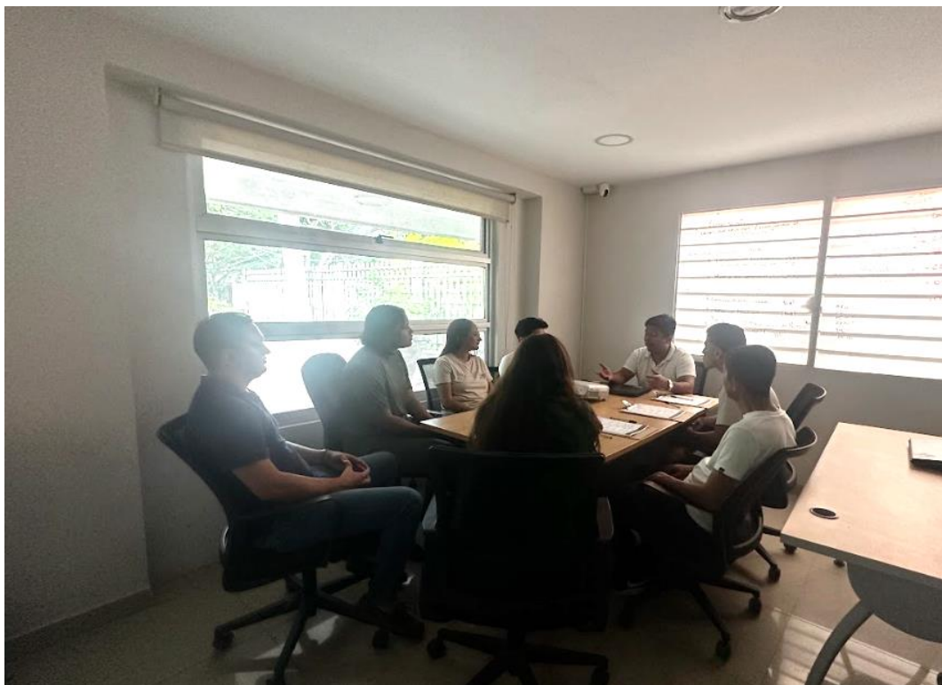
Reunión de alistamiento para socializar el cronograma de actividades y capacitar al equipo de trabajo