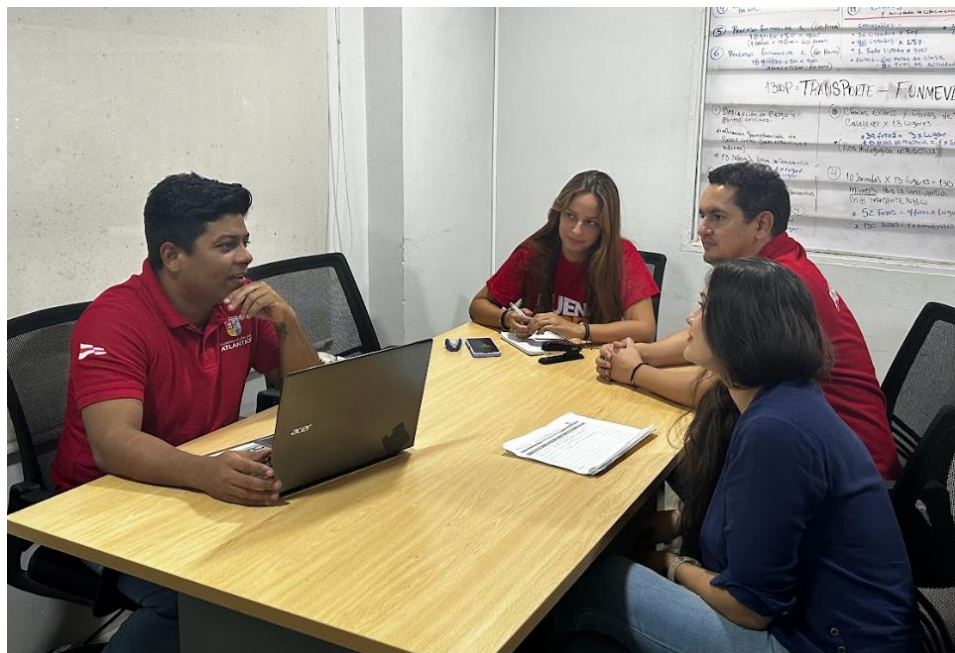
Primera reunión de alistamiento Institucional, explicando las bases del proyecto.

Luego de la primera reunión donde se explicó las bases del proyecto, se convocó al personal nuevamente para la socialización del cronograma y la logística con la que se abordaría el proyecto, lo cual garantizó un manejo homogéneo de la información y el establecimiento de un lenguaje común. Esta práctica fortaleció la cohesión del equipo y permitió construir una visión compartida sobre las metas a corto, mediano y largo plazo. A través de dinámicas participativas, se discutieron metodologías de trabajo, mecanismos de retroalimentación y protocolos de comunicación interna, generando un marco organizativo sólido para la toma de decisiones. La unificación de criterios favoreció un clima de confianza y corresponsabilidad, indispensable para desplegar el proyecto en comunidades con altos niveles de vulnerabilidad social.