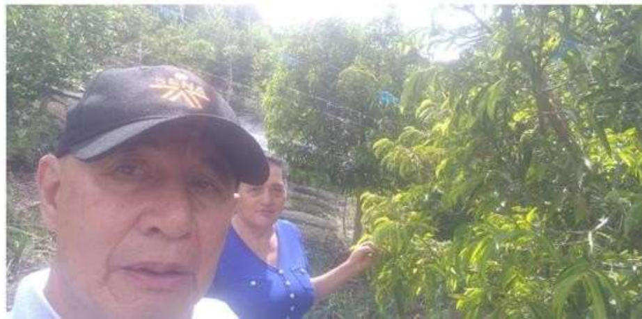
Ficha 3398754 curso complementario en: Básico en Agricultura ecológica Topaipi