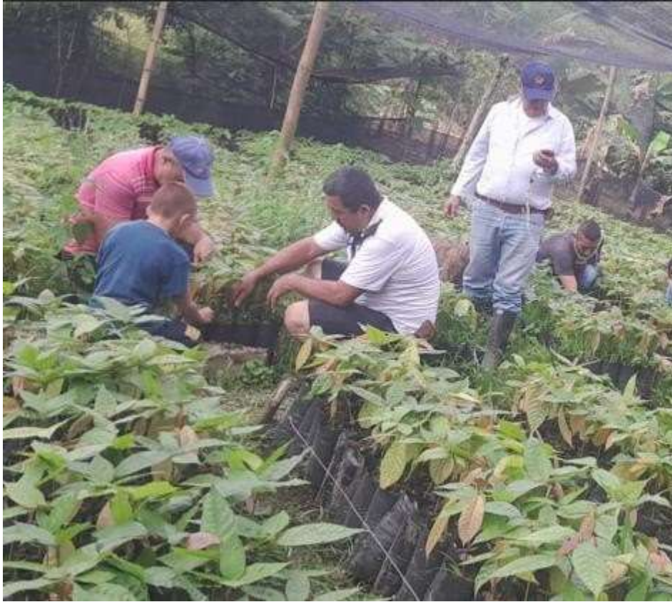
Ficha: 3387157, Buenas Prácticas Agrícolas, Municipio de Yacopí