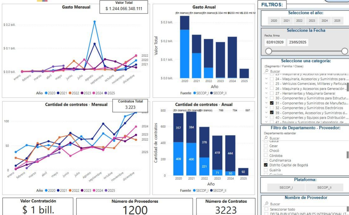
Ilustración 5 - https://www.colombiacompra.gov.co/analisis-de-datos-de-compra-publica/visualizaciones-compra-publica/herramienta-de-visualizacion-para-el-analisis-de-la-demanda-y-de-la-oferta