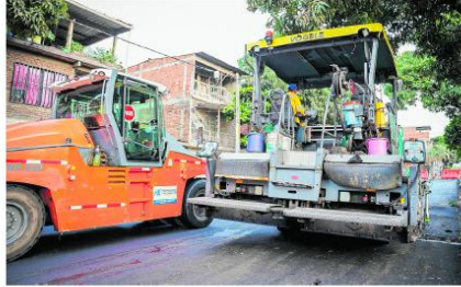
La Alcaldía de Cali interviene la calle 49 de la Comuna 15 con obras de recuperación vial financiadas por el plan Invertir para Crecer.

En este mismo sector, vecinos del barrio El Retiro aseguran que hacia años no veían maquinaria trabajando. La nueva vía beneficia a