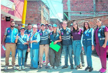
Cali se mantiene en zona de éxito frente al dengue, pero la autoridad sanitaria insiste en no bajar la guardia durante la temporada decembrina.