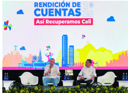
El alcalde Alejandro Eder expuso el balance de sus dos primeros años, enfocados en estabilizar la ciudad y sentar bases para una transformación de largo plazo.

La recuperación de Cali, según el propio alcalde, "ya empezó", aunque su consolidación dependerá de mantener el ritmo de ejecución, fortalecer la seguridad y sostener la confianza ciudadana en los años que restan del mandato.