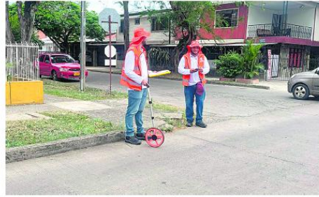
Equipos técnicos recorrieron la malla vial urbana y rural de Cali para actualizar el inventario tras una década sin datos.

Aunque el ritmo de fin de año es acelerado, las proyecciones para el 2026 ya están en marcha. Con el inventario vial actualizado, la ciudad cuenta con una herramienta técnica clave para planificar próximas inversiones.