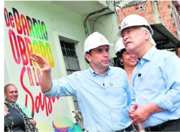
El urbanista surcoreano Young Hoon Kwaak visitó Cali para conocer proyectos