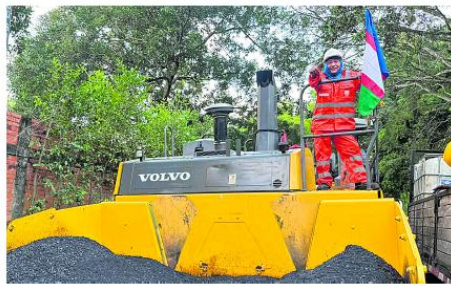
Más de 60 cuadrillas trabajan de manera simultánea en la recuperación de la malla vial urbana y rural de Cali.