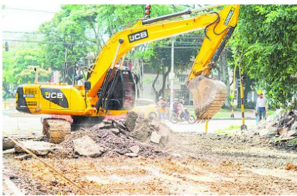
La obra pone fin a más de 20 años de deterioro vial en el barrio El Sena.

peatones, ciclistas, conductores y especialmente a los niños que asisten a los colegios cercanos.