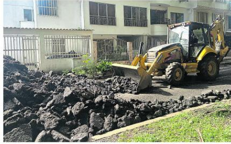
La Secretaría de Infraestructura adelanta obras de recuperación vial en el barrio Ciudad 2000, en la Comuna 16 de Cali

Los corregimientos de Felidia, El Saladito, Golondrinas y La Castilla registran obras que mitigan riesgos, conectan veredas y garantizan movilidad básica para la comunidad campesina.