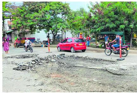
Trabajos de bacheo y mantenimiento vial en sectores estratégicos de Siloé.

Además, el portal web permite a los ciudadanos conocer el avance de cada frente de obra en tiempo real y hacer veeduría sobre los procesos en curso.