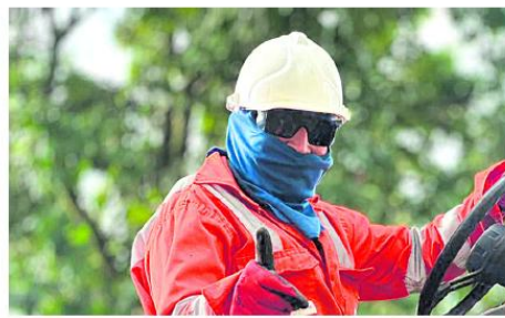
Las intervenciones viales priorizan sectores con deterioro histórico en zona urbana y rural de la ciudad.