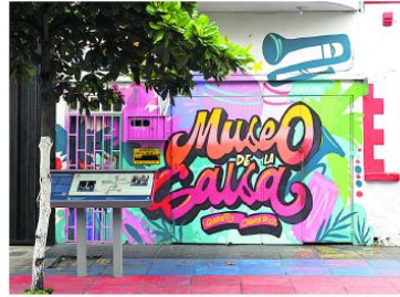
El Museo de la Salsa conserva la memoria musical del barrio Obrero a través de tres generaciones de una misma familia.

Diego 'Michino' Possi, quien ahora combina su tradicional oficio con un negocio de jugos y frutas, reflejan cómo este plan ha sido recibido por los vecinos. A través de capacitaciones, asistencia técnica y entrega de insumos, el programa permite que los habitantes del barrio fortalezcan sus unidades productivas y se preparen para recibir a miles de visitantes durante la Feria de Cali.