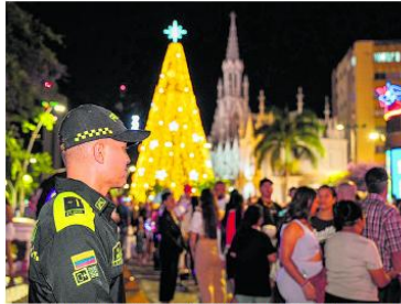
La Policía Metropolitana vigila el Alumbrado Navideño, uno de los puntos con mayor concentración de personas durante las fiestas y la Feria de Cali.

El 'Plan Navidad con propósito' fue presentado el 5 de diciembre de 2025 como la hoja de ruta para enfrentar los retos de seguridad que trae consigo esta época. La Policía