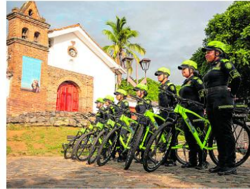
El refuerzo de 4.000 uniformados de la Policía Metropolitana garantiza mayor presencia en calles y eventos de alta afluencia.

El general Henry Bello, comandante de la Policía Metropolitana, indicó que todas las capacidades humanas de la institución están dispuestas para esta temporada, con el objetivo de acompañar a caleños y visitantes. La estrategia incluye patrullajes, controles preventivos y acciones de policía comunitaria para fortalecer la convivencia en barrios y sec-