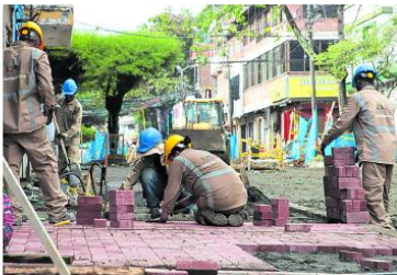
Las obras de adoquinamiento avanzan, eje clave de la renovación urbana del barrio Obrero.

Asimismo, se realizó la feria Cali Sabe a Barrio, con más de 30 emprendimientos gastronómicos del sector, quienes ofrecieron platos típicos y nuevos formatos culinarios con identidad caleña. Esta actividad permitió visibilizar el talento local y generar ingresos para los comerciantes del barrio, en línea con la estrategia de activar la economía desde los territorios.