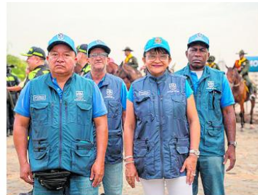
La Policía trabaja junto personal de la Secretaría de Seguridad y la comunidad para fortalecer la convivencia en barrios y espacios públicos.