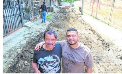
La Alcaldía de Cali entrega una vía pavimentada en el barrio Buenos Aires tras casi cuatro décadas de espera comunitaria.

Los trabajos se ejecutan con todas las especificaciones técnicas de pavimentación, nivelación y compactación. Según la Secretaría de Infraestructura, esta vía estaba en abandono desde hacía más de tres décadas.