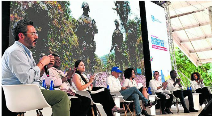
Durante los paneles del evento, secretarios y directivos de la administración distrital entregaron informes detallados sobre avances, inversiones y resultados en cada una de las dependencias.