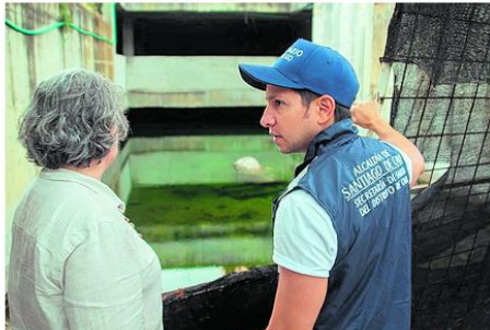
Con revisión de sumideros, control biológico con peces guppies, aplicación de insecticidas, fumigaciones y estrategias educativas, Cali ha logrado reducir los contagios.

agua: Mantener tanques, albercas y depósitos bien tapados y en adecuado estado de limpieza.