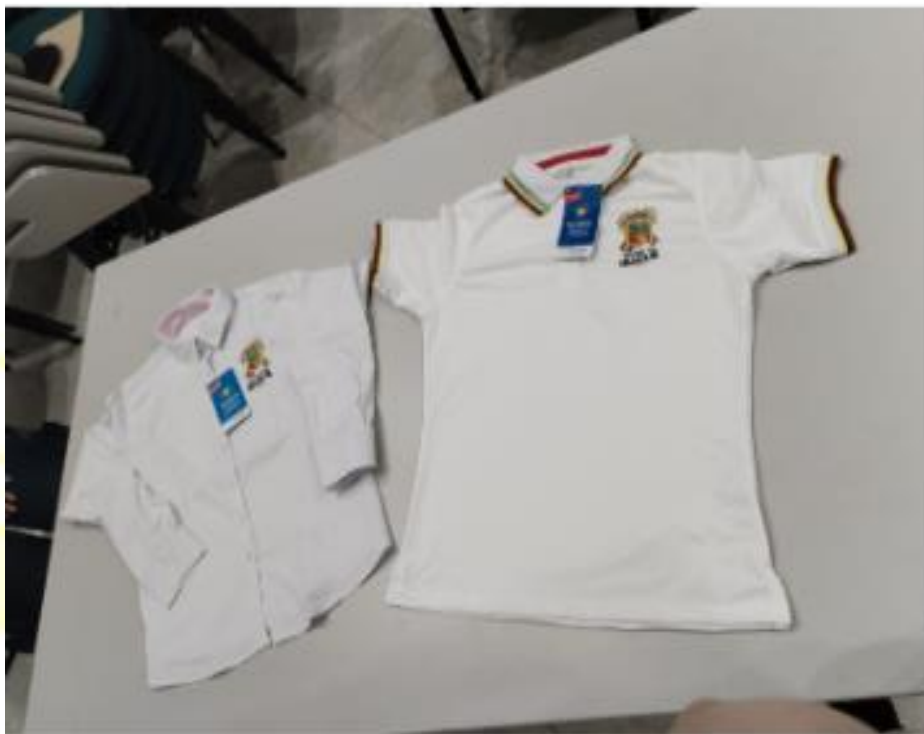
Imagen N° 2. Revisión y verificación elementos - Alcaldía de Ibagué