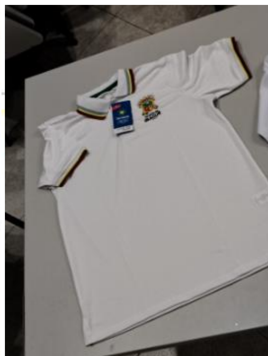
Imagen N° 6. 7 y 8: Indumentaria Institucional - Alcaldía de Ibagué (camisa y camibuso caballero)

DIRECCION: CR 20 # 90 - 04 LC 05 CC ARROYUELOS CORREO: contrataciones@comercializadoracdt.com TEL. 3106797766