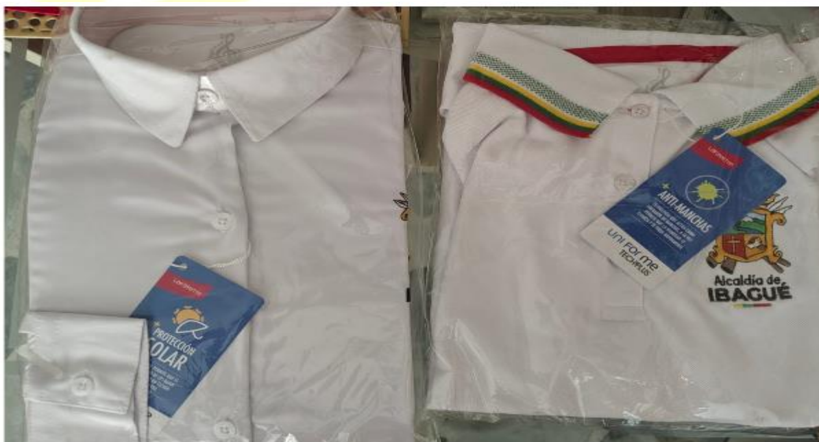
Imagen N° 3, 4 y 5. Indumentaria Institucional - Alcaldía de Ibagué (camisa y camibuso dama)

DIRECCION: CR 20 # 90 - 04 LC 05 CC ARROYUELOS CORREO: contrataciones@comercializadoracdt.com TEL. 3106797766