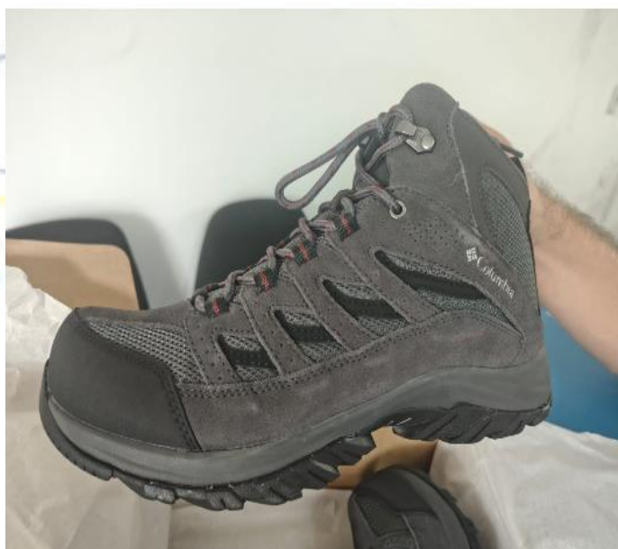
Imagen N° 9, 10 y 11. Dotación trabajadores oficiales

Agradezco la atención prestada dejando constancia de que el contratista ejecutó de manera satisfactoria el contrato, cumpliendo integralmente con el objeto contractual y las obligaciones establecidas, y entregando la dotación institucional en las condiciones, tiempos y calidad requeridos, la cual fue recibida a conformidad por el supervisor del contrato.