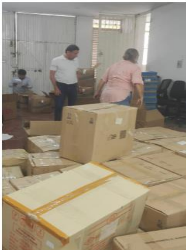
Imagen N° 1. Entrega elementos Alcaldía de Ibagué