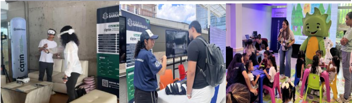
Cierre actividades de decoración y Alumbrado Navideño Malecón del Río.