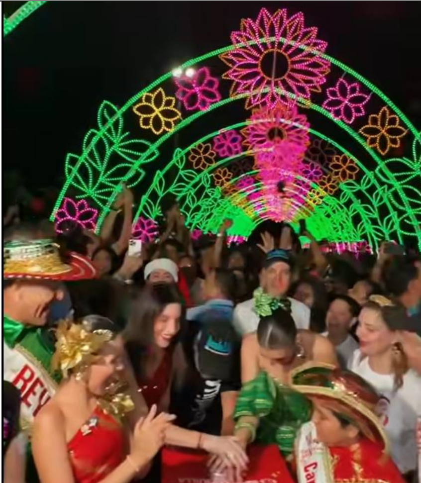
QR y placa Árbol Somos Barranquilla.