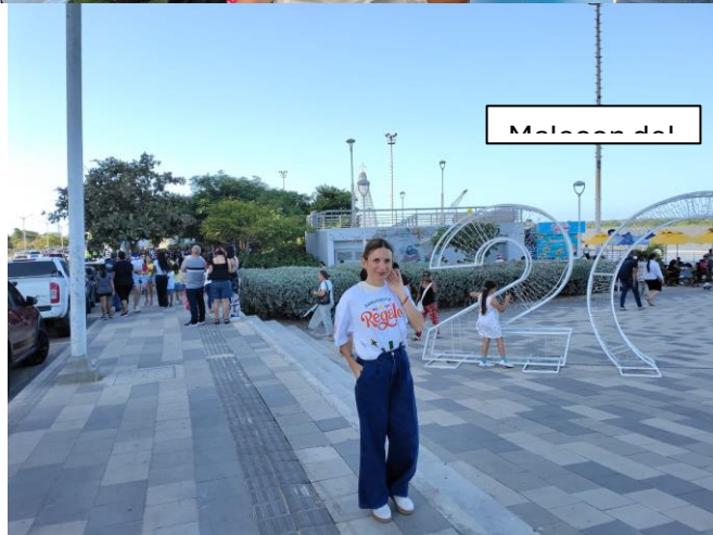
Inauguración Luna del Río.