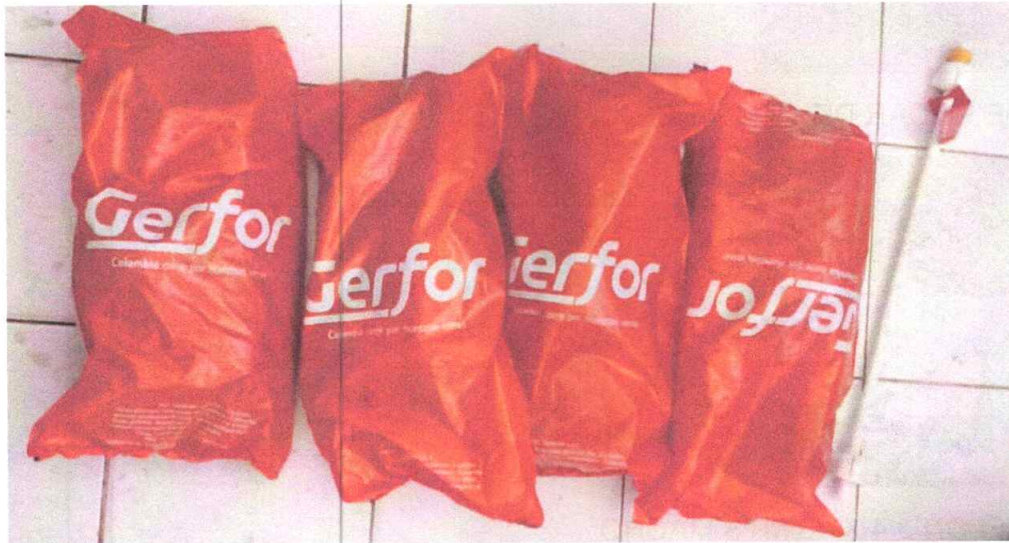
PALA HOYADOR REF.5406-10 HERRAGRO