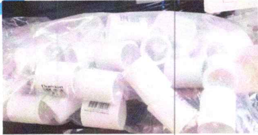
TAPON PRESION SOLD 1/2 GERFOR

CORICELLA OBRA CONSULTORIA Y SUMINISTROS