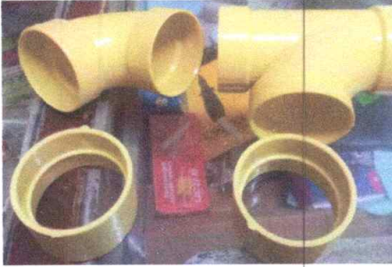
FLOTADORES PARA BAÑO