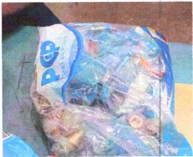
CHEQUE CORTINA 1/2 GRIVA