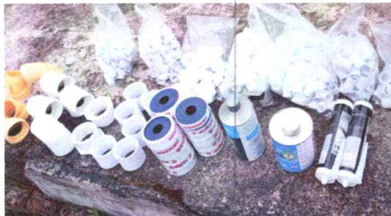
LADRILLO PERFORADO ROSADO