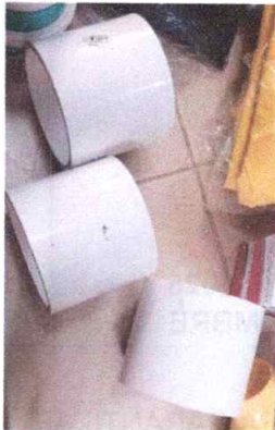
UNION MECANICA PASANTE 3 GERFOR