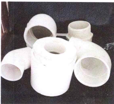
UNION PRESION 2 GERFOR