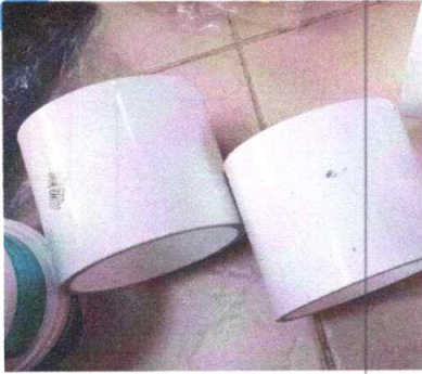
UNION RAPIDA 2 GERFOR

CORICELLA OBRA CONSULTORIA Y SUMINISTROS