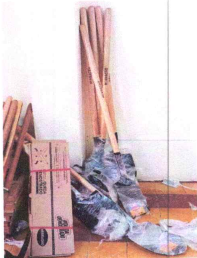
CARRETA CHASIS METAL NEGRA LLANTA