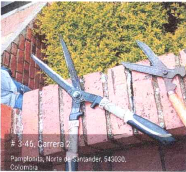
CINTA TEFLON 3/4 X 15 MTS MACHO