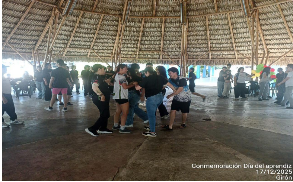
Conmemoración Día del aprendiz 17/12/2025 Girón