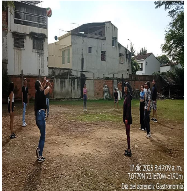
17 dic 2025 8:49:09 a. m. 7.0779N 73.1670W ±1.90m Día del aprendiz Gastronomía