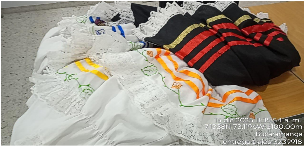
ENTREGA INSUMOS PARA EL DIA DEL APRENDIZ GASTRONOMIA