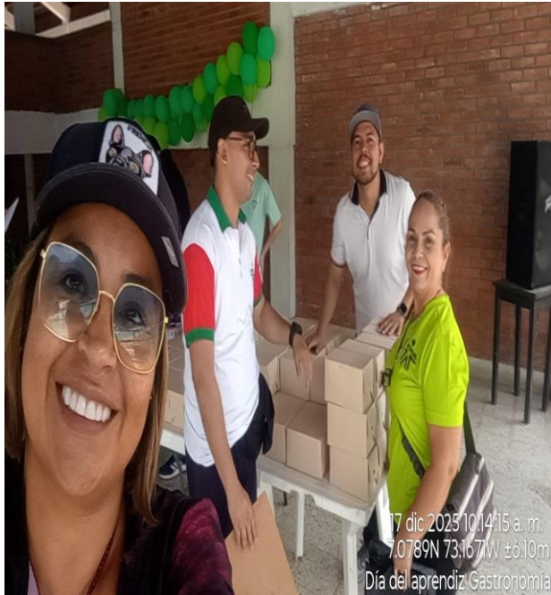
17 dic 2025 10:14:15 a. m. 7.0789N 73.167W ±6.10m Día del aprendiz Gastronomía