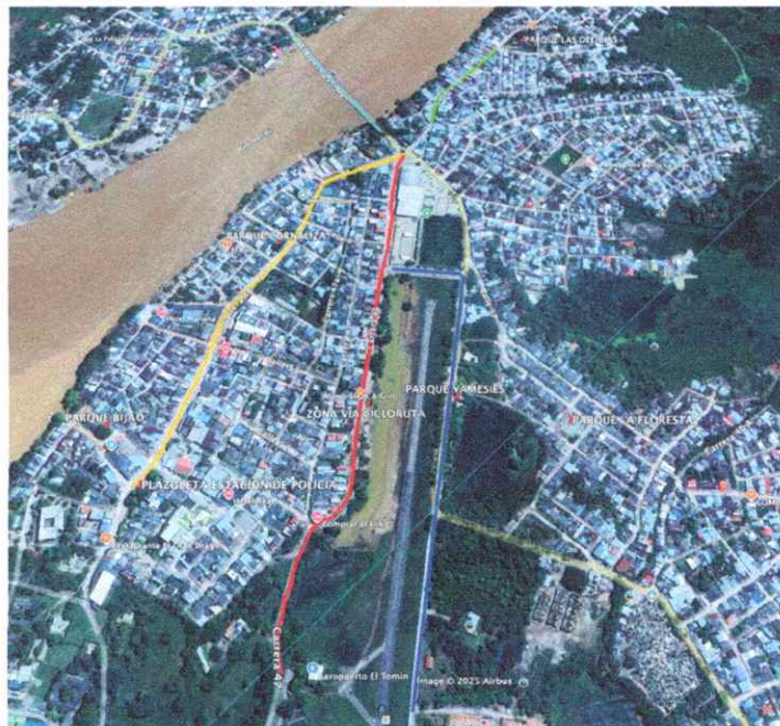
Imagen 2. Localización de iluminación navideña en avenidas y parques

En la imagen anterior se observa la intervención del parque Bijao, Cornaliza, La Floresta, Yamesies, además de la plazoleta de la Policía Nacional y la zona de la cicloruta, mientras que las avenidas estas contarán con la respectiva iluminación La Juventud (glorita – estación de policía), Echeverri (aeropuerto El Tomín – glorieta), Parque Yamesies (intersección con la av. Echeverri – entrada urbanización Bosques de Mineros), puente La Libertad y como último sector la conocida Zona Rosa