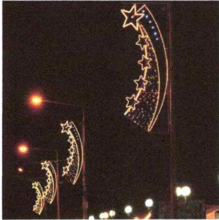
Imagen 5. Estructuras decorativas para postes (separador central, andenes, parques, espacio público)

Por todo lo anterior se concluye que es una necesidad del municipio, a través de la Secretaria de Planeación, realizar el alquiler, mantenimiento, montaje e instalación del alumbrado navideño, convirtiendo al municipio en una experiencia cultural y de alegría para la comunidad y de gran impacto e importancia para ciudadanos y visitantes, siendo, además, motor de empleo y nuevas redes de interacción social y visibilidad en el bajo cauca. A continuación, se observan imágenes ilustrativas de elementos decorativos imperantes en este.