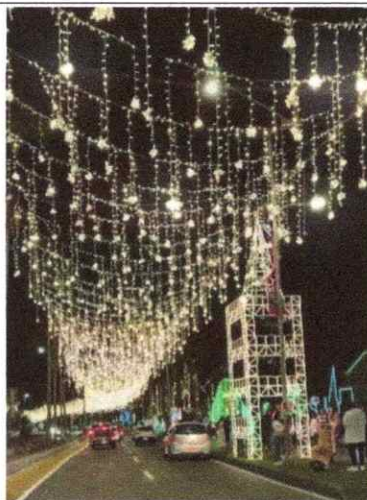
Imagen 10. Estructura navideña para conformación de cielo estrellado en la zona rosa