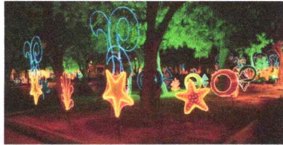
Fotografía 6. Estructuras decorativas para andenes, parques, espacio público.