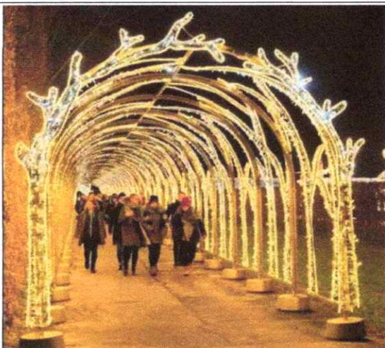
Imagen 9. Arco navideño con dimensiones de 3m x 2,5m