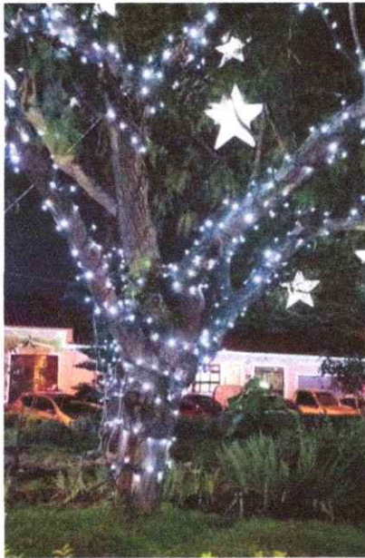
Imagen 7. Luces navideñas tipo manguera en zonas verdes, parques y andenes.