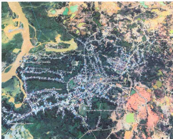
Imagen 4. Localización de iluminación en el corregimiento de Puerto López.