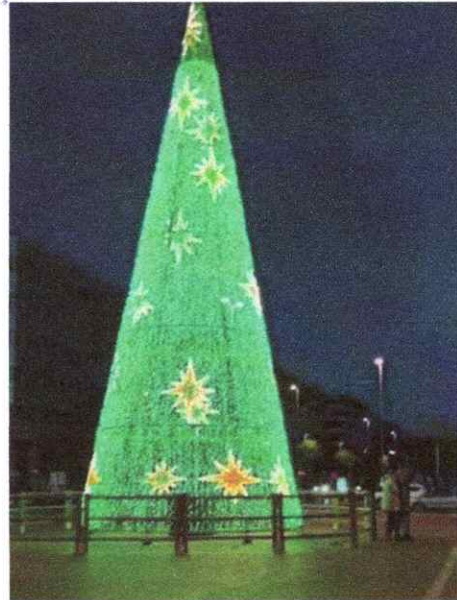
Imagen 8. Árbol navideño de diámetro 2,5m.