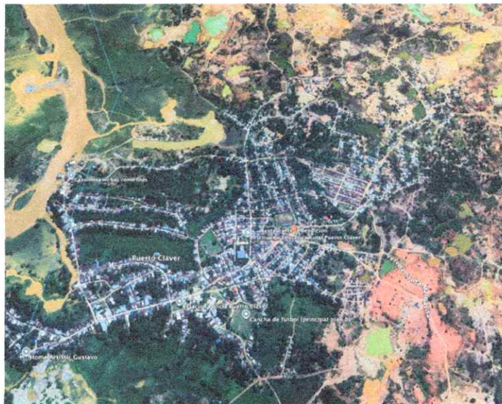
Imagen 3. Localización de iluminación en el corregimiento de Puerto Claver.