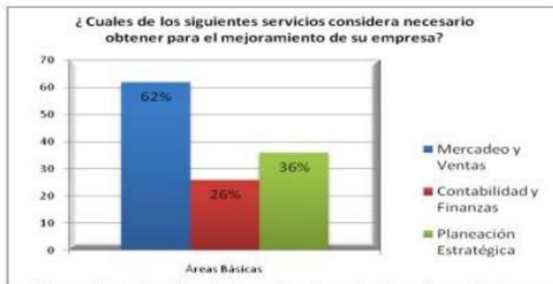
Ilustración 6. Servicios de Asesoría y Consultoría en Áreas Básicas

finanzas, así como lo evidencia el siguiente gráfico.