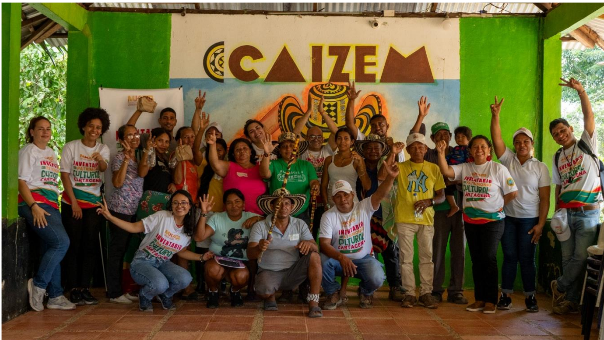
Foto 5: Foto grupal 5to Taller de Grupo Focal, en la comunidad zenú del Cabildo CAIZEM, vereda de Membrillal, el día 28 de octubre