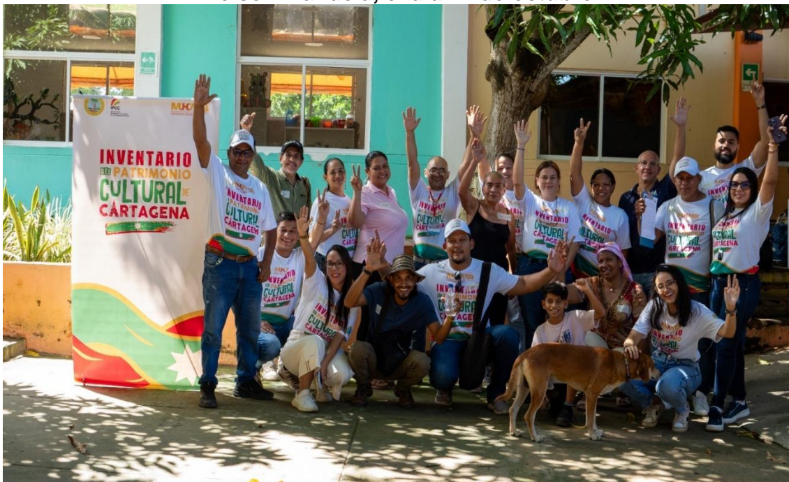
Foto 3: Foto grupal 3er Taller de Grupo Focal, en la comunidad rural de Membrillal, el día 25 de octubre