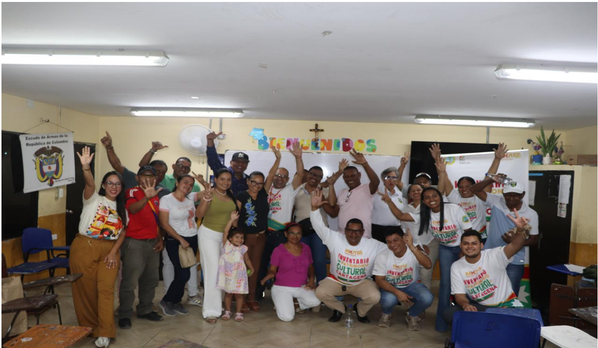
Foto 4: Jornada de concertación del Proyecto PCI de Cartagena en la Localidad 3, en la comunidad barrial de San Fernando, el día 24 de octubre