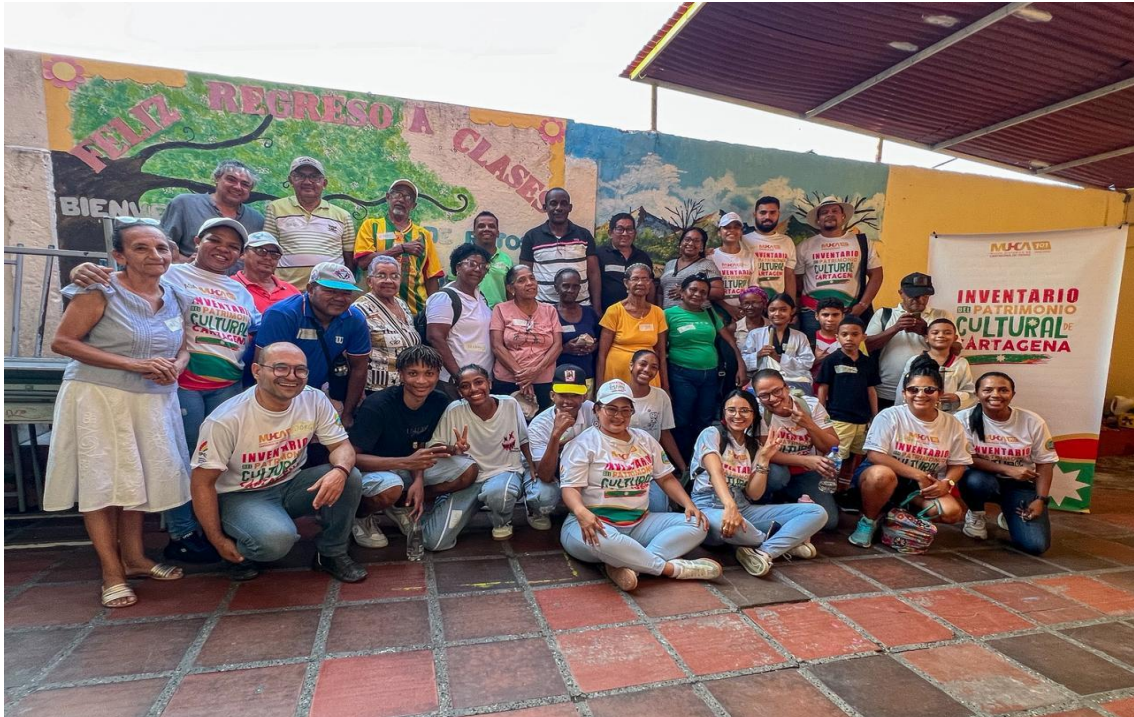
Foto 8: Foto grupal 9no Taller de Grupo Focal, en la comunidad barrial de María Cano, el día 1 de noviembre