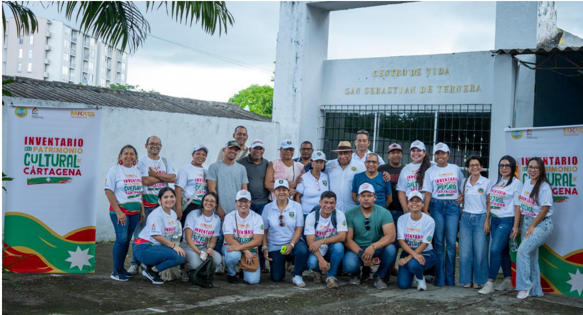
Foto 1: Jornada de concertación en el barrio Ternera, 18 de octubre de 2025