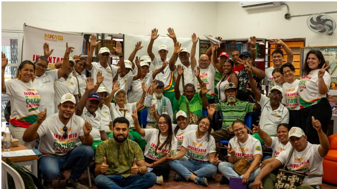
Foto 1: Foto grupal 1er Taller de Grupo Focal, en el corregimiento de Pasacaballos, el día 23 de octubre