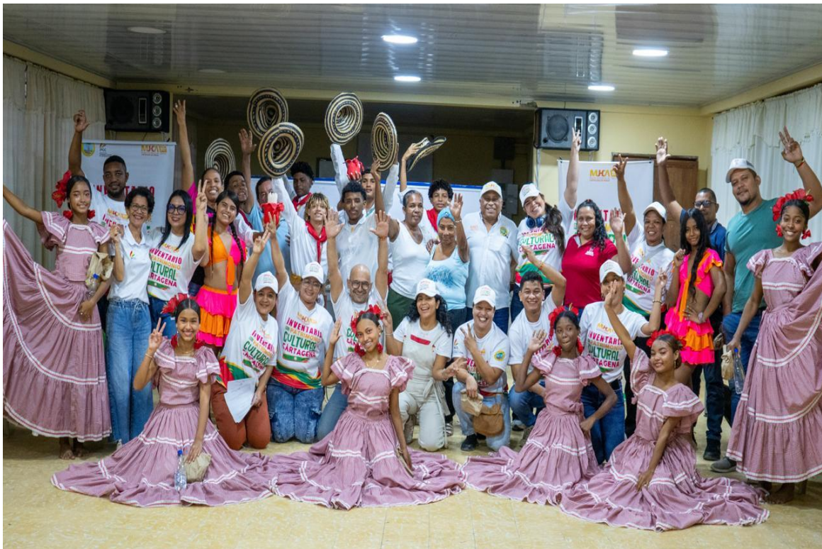
Foto 2: Jornada de concertación en el barrio Arroz Barato, 18 de octubre de 2025