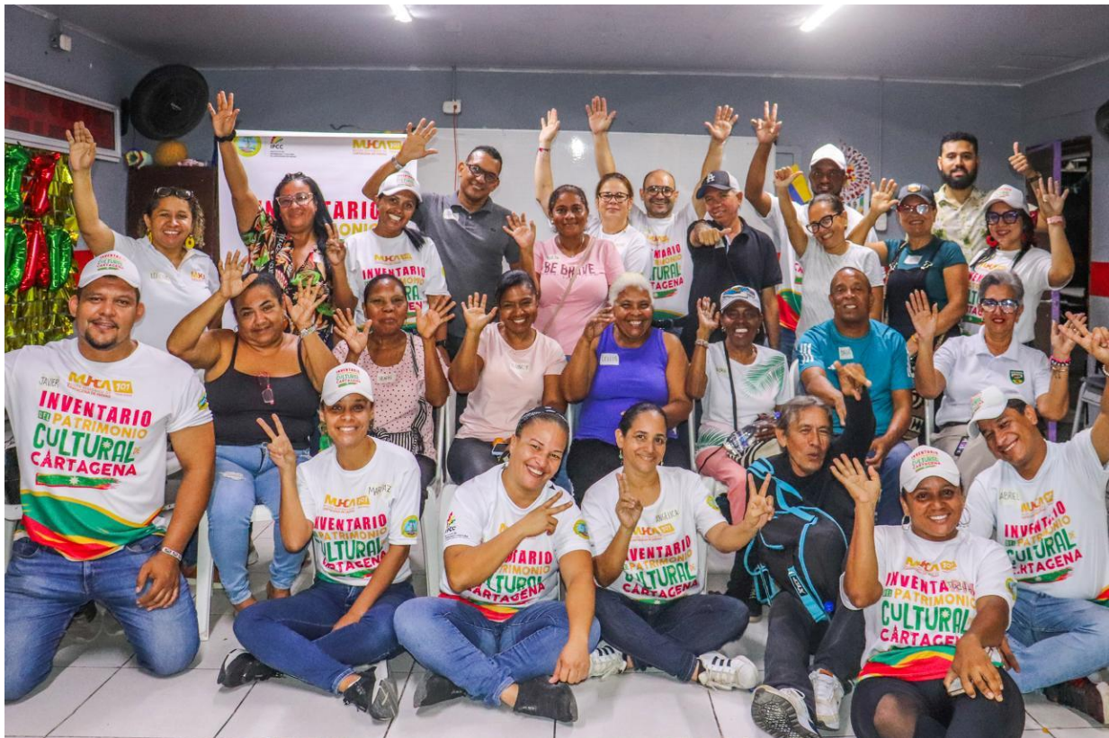
Foto 8: Foto grupal 13vo Taller de Grupo Focal, en la comunidad barrial de San Fernando, el día 10 de noviembre de 2025