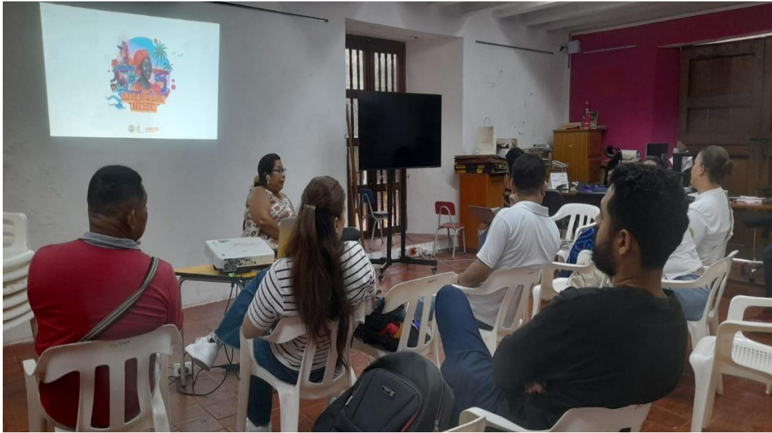
Foto 2: 4ta capacitación técnica, sobre patrimonio material en las instalaciones del Museo Histórico de Cartagena (MUHCA), 21 de octubre de 2025