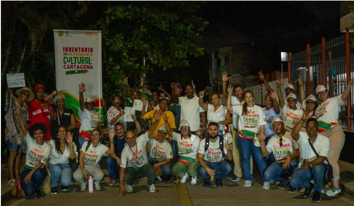
Foto 4: Foto grupal 4to Taller de Grupo Focal, en la comunidad barrial de Ceballos, el día 27 de octubre