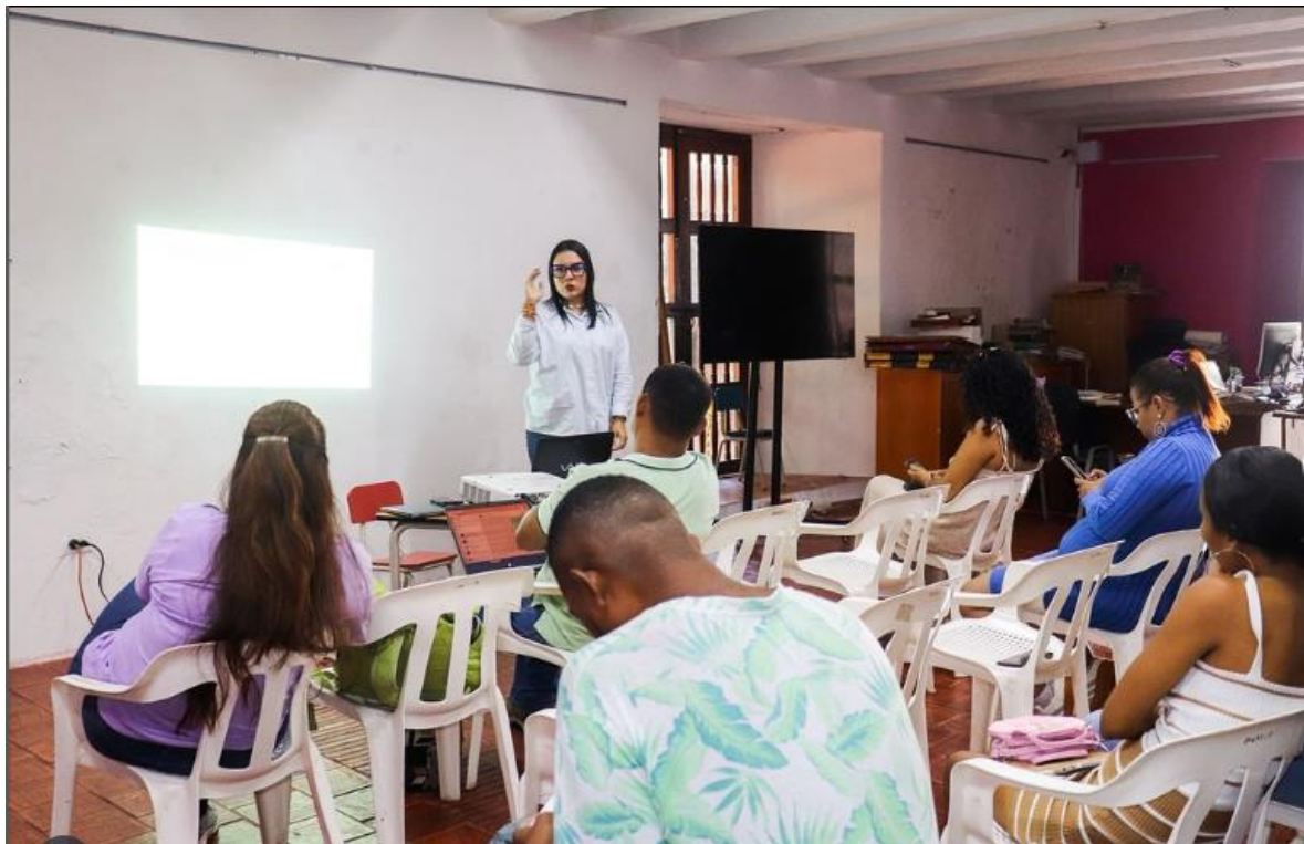
Foto 1: 3ra jornada de capacitación con los equipos técnicos, profesionales y de gestores comunitarios, 15 de octubre de 2025 en MUHCA