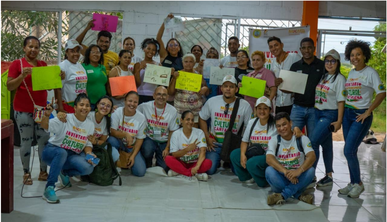
Foto 2: Foto grupal 2do Taller de Grupo Focal, en la comunidad barrial de Nelson Mandela, el día 24 de octubre