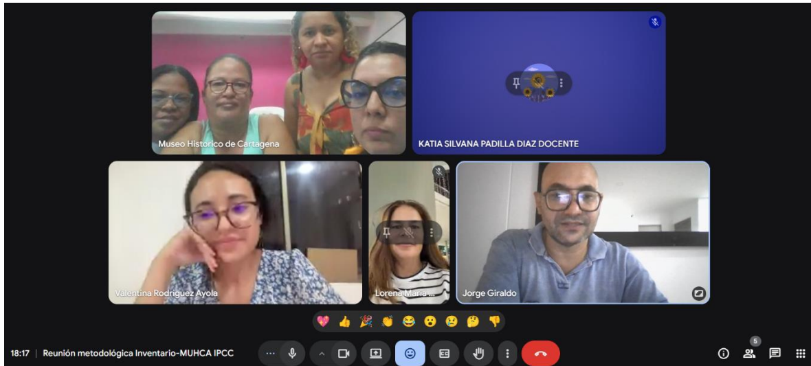
Anexos 1. Reunión (virtual) del equipo profesional con la Coordinación General del Proyecto, para la revisión de la propuesta del Taller del Grupo Focal, 20 de octubre de 2025