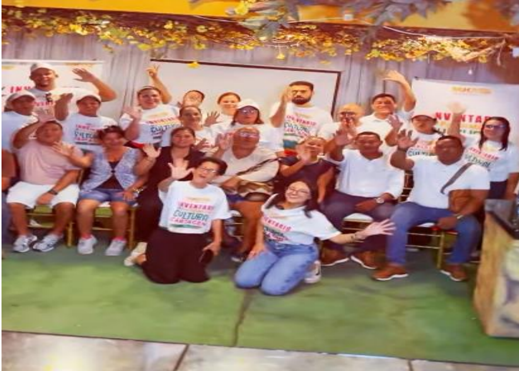
Foto 3: Jornada de concertación del Proyecto PCI de Cartagena en la Localidad 3, en la comunidad barrial de Blas de Lezo, el día 22 de octubre