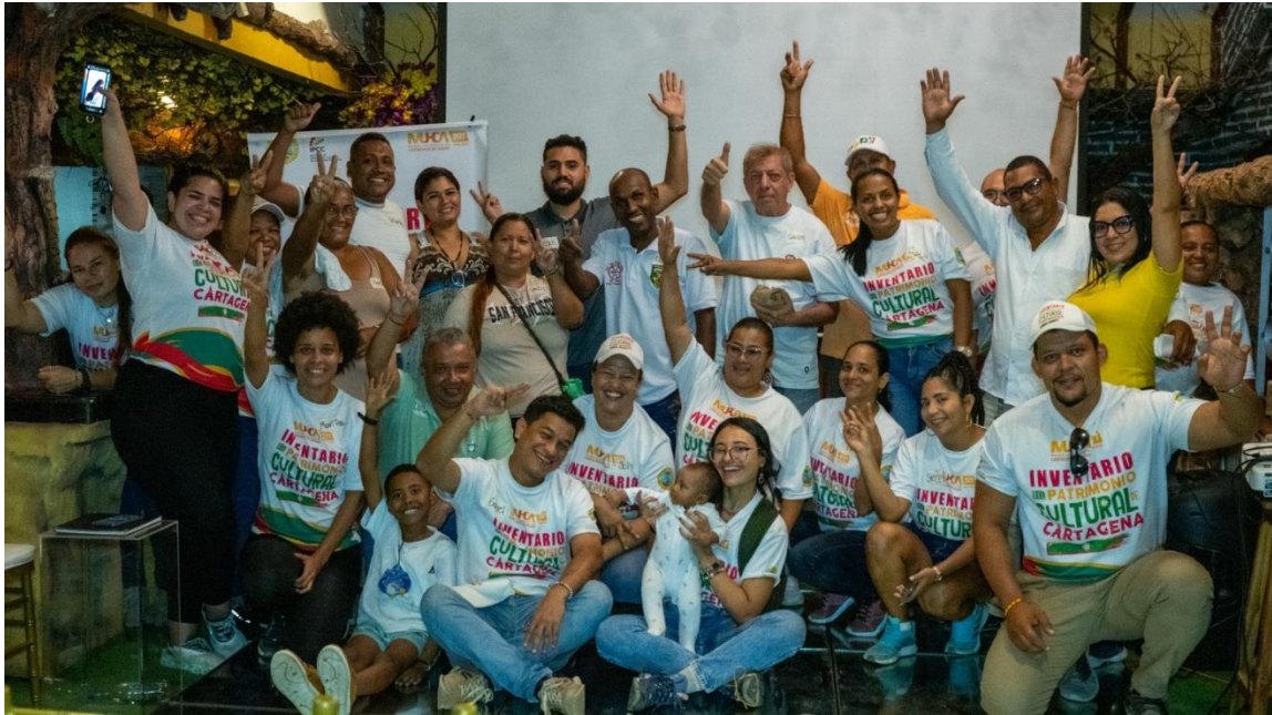
Foto 6: Foto grupal 6to Taller de Grupo Focal, en la comunidad barrial de Blas de Lezo, el día 28 de octubre