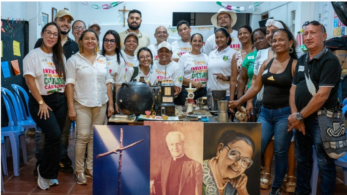
Foto 7: Foto grupal 8vo Taller de Grupo Focal, en la comunidad barrial de San Pedro Mártir, el día 30 de octubre