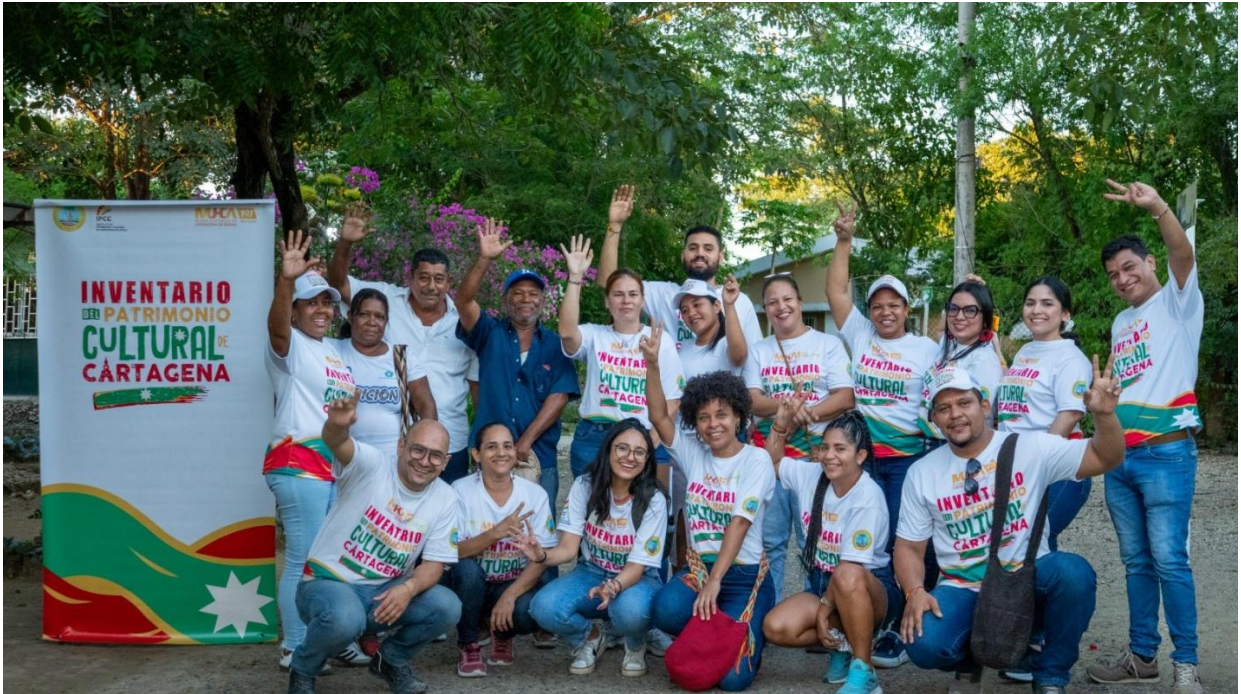
Foto 5: Jornada de concertación previa del Proyecto PCI de Cartagena en la Localidad 3, en la comunidad barrial de Arroz Barato, el día 25 de octubre