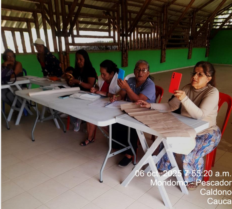
06 oct. 2025 7:55:20 a.m. Mondomo - Pescador Caldono Cauca