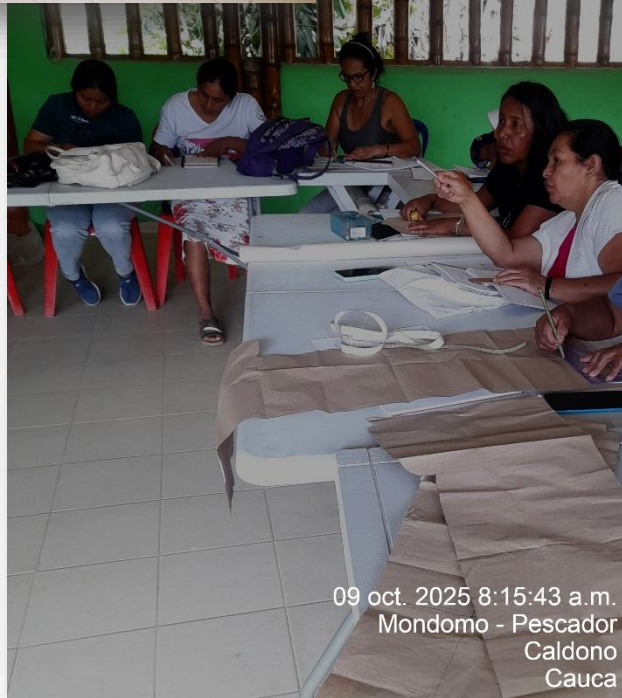
09 oct. 2025 8:15:43 a.m. Mondomo - Pescador Caldono Cauca