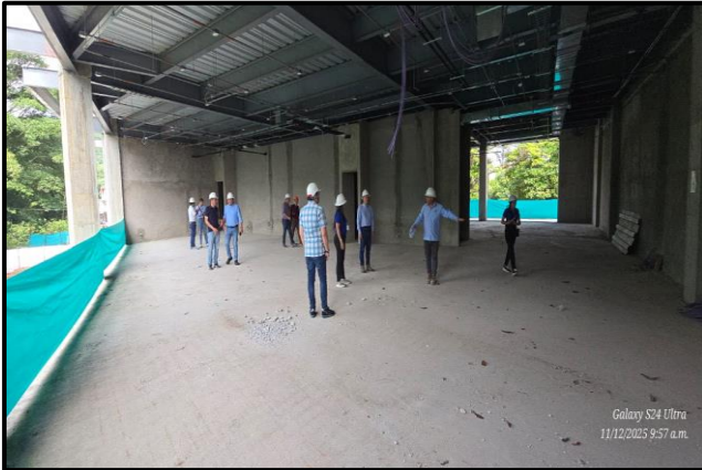
Oficinas Administrativas (segundo piso) Lugar: Centro Cultural (Barrio San Fernando) Fecha: Diciembre 11 de 2025