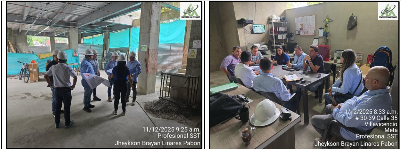
Corredor entrada principal Lugar: Centro Cultural (Barrio San Fernando) Fecha: Diciembre 11 de 2025 Reunion visita de obra Lugar: Centro Cultural (Barrio San Fernando) Fecha: Diciembre 11 de 2025