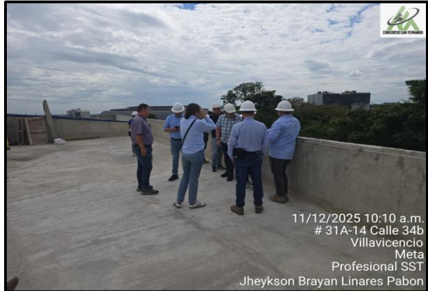
Terraza (cuarto piso) Lugar: : Centro Cultural (Barrio San Fernando) Fecha: : Diciembre 11 de 2025