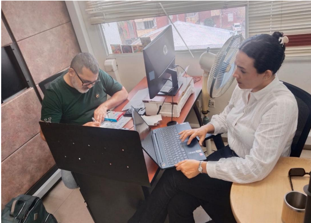
Figura 3. Imagen de la reunión en las instalaciones de Corpoguajira

La Guajira correspondiente al mes de diciembre, en articulación con los actores sectoriales involucrados en los diferentes espacios de La Gerencia Guajira de la Oficina de Asuntos Ambientales y Sociales del Ministerio de Minas y Energía, en el marco de la Transición Energética Justa y de los proyectos de Fuentes No Convencionales de Energía Renovables FNCER.