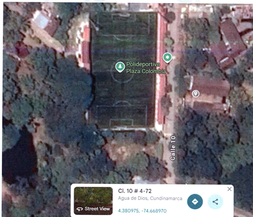
Ilustración 1 Google Maps

El proyecto a realizar en el Municipio de Agua de Dios Cundinamarca, se denominó "MEJORAMIENTO Y ADECUACION DEL EQUIPAMIENTO MUNICIPAL ESCUELA FRANCISCO VAN GALEN DEL MUNICIPIO DE AGUA DE DIOS CUNDINAMARCA"