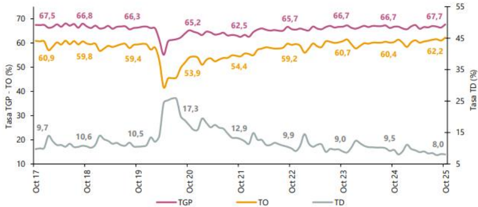
Gráfico 3. Tasa global de participación (TGP), Tasa de ocupación (TO) y Tasa de desocupación (TD) Total 13 ciudades y áreas metropolitanas Octubre (2017 - 2025)

En octubre de 2025, la tasa de desocupación en el total de las 13 ciudades y áreas metropolitanas fue 8,0%, lo que representó una disminución de 1,4 puntos porcentuales respecto al mismo mes de 2024 (9,5%). La tasa global de participación se ubicó en 67,7%, mientras que en octubre de 2024 fue 66,7%. Finalmente, la tasa de ocupación fue 62,2%, lo que representó un aumento de 1,8 puntos porcentuales respecto al mismo mes de 2024 (60,4%).