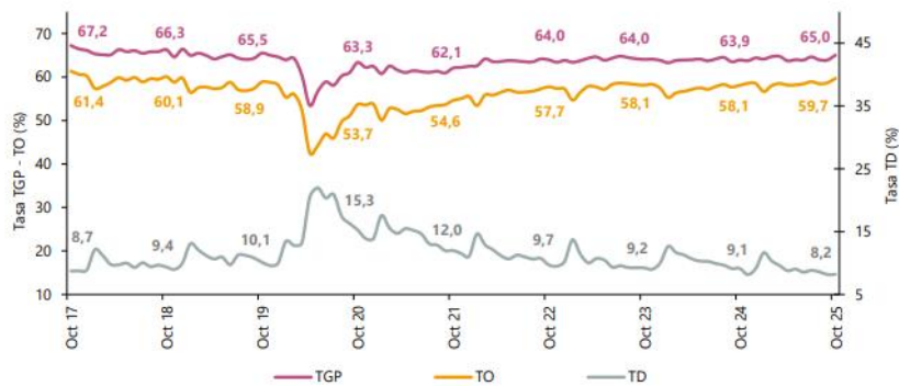
Gráfico 1. Tasa global de participación (TGP), Tasa de ocupación (TO) y Tasa de desocupación (TD) Total nacional Octubre (2017 - 2025)

Fuente: DANE, Gran Encuesta Integrada de Hogares (GEIH).