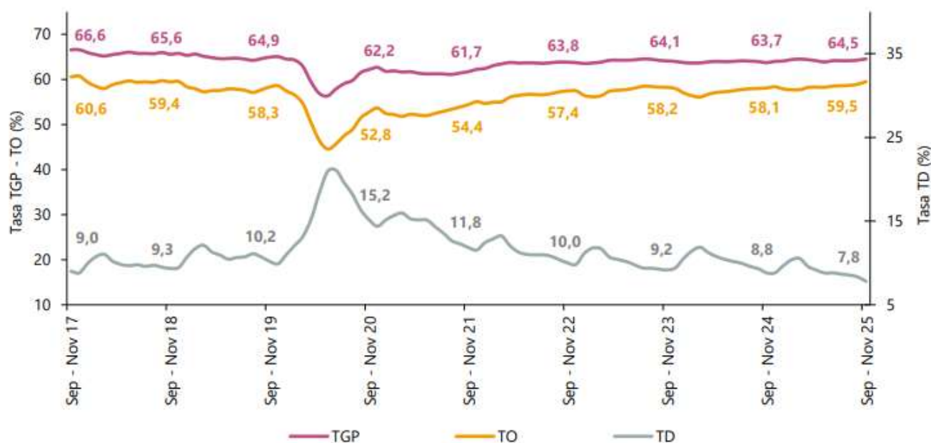
Gráfico 4. Tasa global de participación (TGP), Tasa de ocupación (TO) y Tasa de desocupación (TD) Total nacional Septiembre - noviembre (2017 - 2025)

Finalmente, la tasa de ocupación fue 59,5%, lo que representó un aumento de 1,4 puntos porcentuales respecto al trimestre móvil septiembre - noviembre 2024 (58,1%).