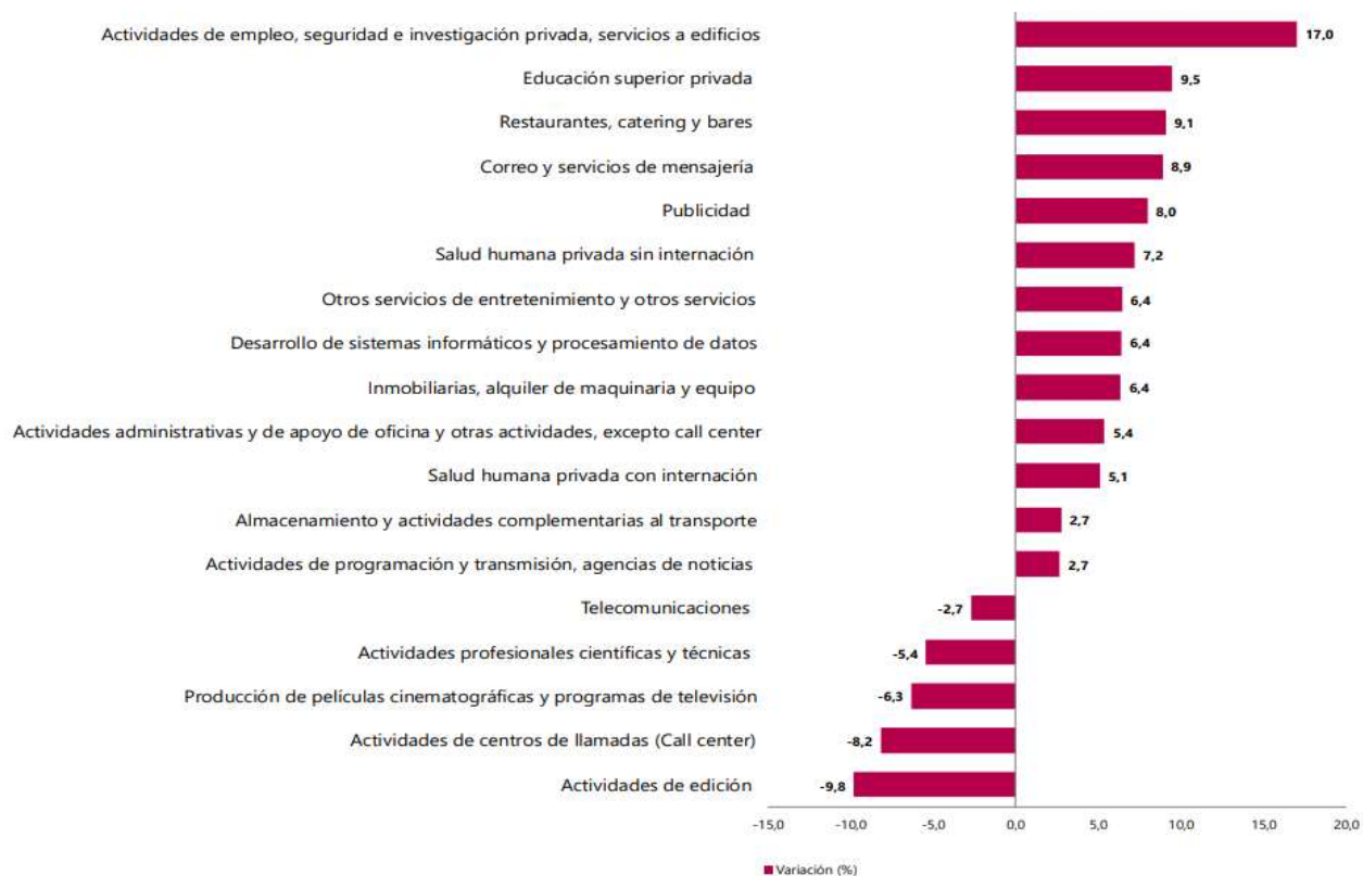
Gráfico 1. Variación anual de los ingresos nominales, según subsector de servicios Total nacional Octubre 2025 P / octubre 2024

En el proceso permanente de mejoramiento y actualización de las estadísticas económicas y con el propósito de responder a estándares nacionales e internacionales, tanto metodológicos como de clasificación, a partir del mes estadístico enero de 2020 se dan a conocer al público los resultados del rediseño de la Encuesta Mensual de Servicios que contempla varias mejoras metodológicas como la inclusión de resultados de la variable variación de los salarios promedio por subsector de servicios y tipo de contratación, además del paso a un muestreo probabilístico basado en un marco mejorado que incrementó la cobertura al implementar menores parámetros de inclusión: