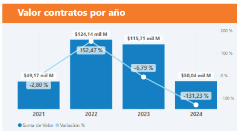
Gráfico. Valor histórico necesidades de la categoría de Servicios Profesionales cifras en miles de millones COP

Para el 2024 la categoría de Servicios profesionales tuvo una inversión de $50.039.674.395 COP, que corresponden a 1.34% del total del gasto del Distrito de Ciencia Tecnología con 304 necesidades de compra.