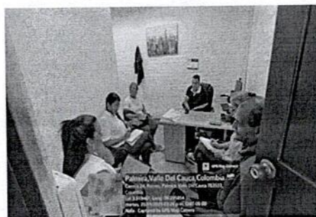
REUNIÓN DE EQUIPO