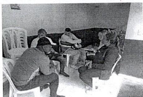
REUNIÓN CON LÍDERES