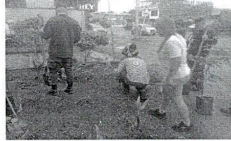
Siembra y recuperación de espacio barrio guayabal